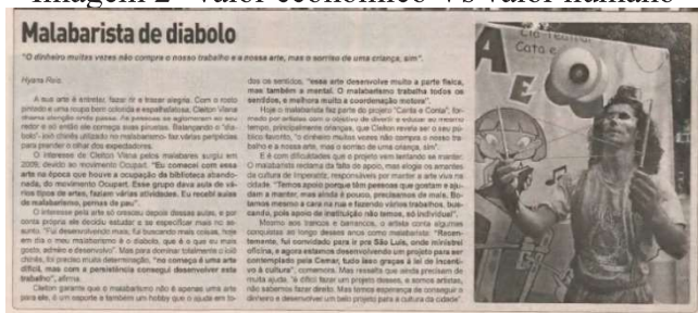
Imagem 2- Valor econômico Vs valor humano

Sendo impossível abordar aqui, os processos de aprendizagem de forma detalhada, iremos nos limitar a comentar que a postura crítica em frente aos semáforos não seria algum tipo de devaneio ou sinal de vagabundagem como apontam os estigmas sociais que afetam esses artistas, mas trata-se de um caminho de formação cidadã resultado de muitas formas de intercâmbio e socializações em muitos espaços.