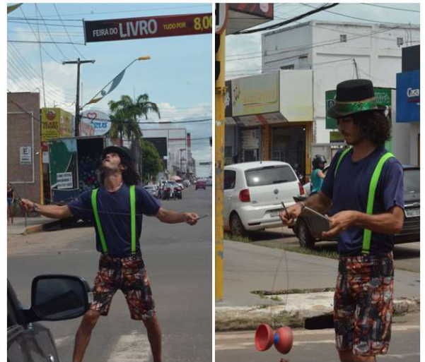
Imagem 3 – técnica corporal com o diabolô

ção de sujeitos e objetos, é possível falar em “sujeitos da ação” e “objetos da ação”, pois em determinadas situações o humano pode ser sujeito, mas também poderia ser “objeto” trabalhado em outras (MURA, 2011). Em sentido similar, há casos em que os objetos, a depender do jogo de relações estabelecida entre as partes. É nesse sentido em que se pode pensar a paisagem dos semáforos carregadas no próprio corpo do artista, e viés próximo da corpografia (NASCIMENTO, 2016) e da noção de paisagem de tarefas (INGOLD, 2021).