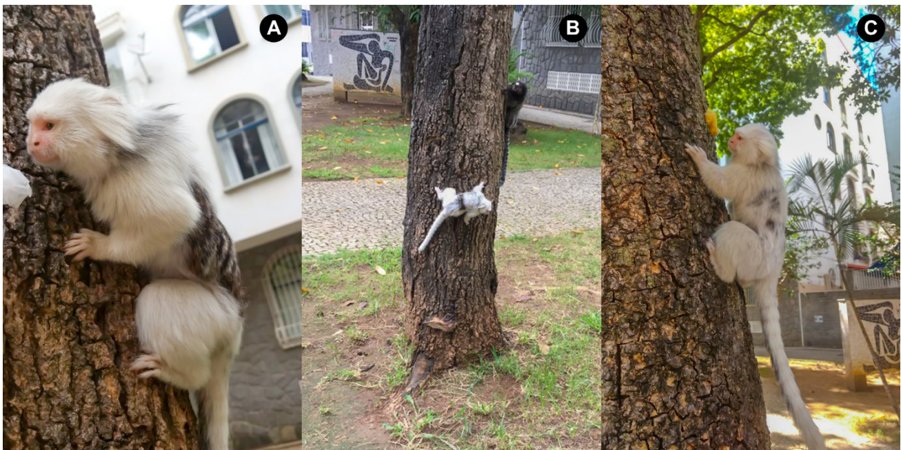
Figura 3. Saguis ( Callithrix penicillata ) leucísticos adultos, registrados na praça Jarbas de Lery Santos, localizada no Bairro São Matheus no município de Juiz de Fora, Minas Gerais.

Em saguis, especificamente para o gênero Callithrix , encontramos o registro de Leucismo, de uma fêmea adulta resgatada pelo projeto Mucky (MANGESTE, 2016), em dois animais no Rio de Janeiro, um em Amparo- SP e outro Itatibaia-SP (AXIMOFF et al. , 2017), e de um único animal em Joinville- SC (TUSSOLINI et al. , 2017) sendo este, portanto, o primeiro registro oficial de Leucismo em Callithrix em Minas Gerais.