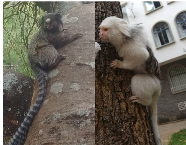
Figura 1. A esquerda sagui ( Callithrix penicillata ) adulto, com padrão de coloração da pelagem típico da espécie. A direita sagui ( Callithrix penicillata ) adulto, leucísticos registrado neste estudo Foto: Caroline do Vale, 2017; Bruno Barbosa, 2017.

São animais arborícolas, que vivem em diversos habitats, florestas primárias e secundárias, fragmentos degradados e áreas urbanas como praças, parques, jardins (OLIVEIRA et al. , 2015). São bem-sucedidos nos ambientes urbanos, pois consomem uma ampla variedade de itens alimentares, inclusive comida ofertada por humanos (RIBEIRO & PREZOTO, 2011; VALE et al. , 2011; VALE & PREZOTO, 2015).