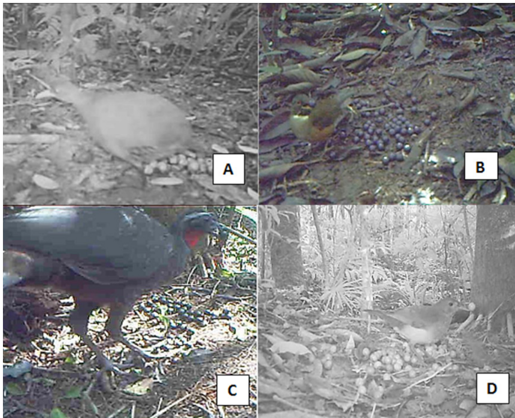
Figura 3. Aves que interagiram com os frutos de Euterpe edulis em área de Floresta Ombrófila Densa, em Maquiné, RS, registradas por filmagens. (a). Crypturellus tataupa (Inhanbu-chintã); (b). Turdus albicollis (Sabiá-coleira); (c). Penelope sp. (Jacu) e (d). Turdus leucomelas (Sabiá-barranco).

Todas as espécies de aves foram observadas consumindo os frutos diretamente no solo (Figura 3). O gênero Turdus , representado por três espécies nas filmagens, T. albicollis Vieillot, 1818, T. leucomelas Vieillot, 1818 e T. rufiventris Vieillot, 1818, despolpou, engoliu ou carregou um total de 412 frutos (34%). Dentre as aves, T. albicollis foi a que mais interagiu com os frutos da palmeira, principalmente engolindo os frutos inteiros (Tabela 1). Turdus leucomelas e T. rufiventris , por sua vez, predominantemente carregaram ou despolparam frutos depositados