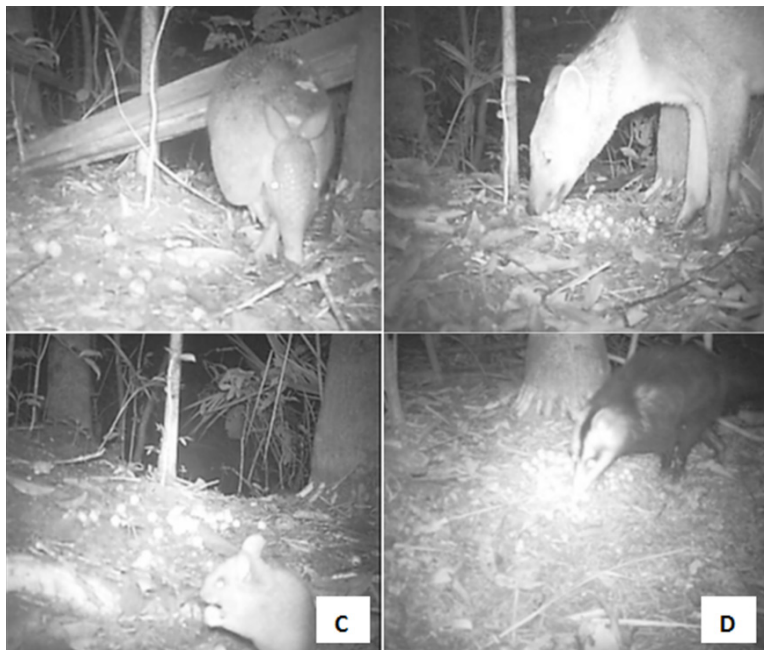
Figura 2. Mamíferos que interagiram com os frutos de Euterpe edulis em área de Floresta Ombrófila Densa, em Maquiné, RS, registrados por filmagem. (a). Dasybus novemcinctus (Tatu-galinha); (b). Cerdocyon thous (Graxaim-do-mato); (c). Sooretamys angouya (Rato-do-arroz) e (d). Didelphis albiventris (Gambá-de-orelha-branca).

Dentre os mamíferos, os pequenos roedores apresentaram o maior número de interações, representados por duas espécies: Sooretamys angouya e Oligoryzomys nigripes