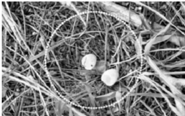
Figura 1. Ninho de Nyctidromus albicollis estudado no ano de 2005 em Seropédica, RJ.