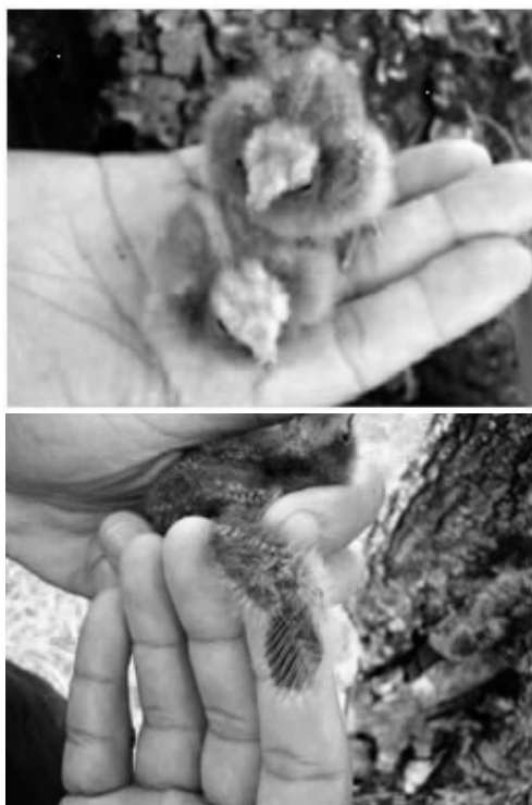
Figura 2. Ninhego de Nyctidromus albicollis : (A) com idade de um dia de vida, (B) ninhego com cinco dias de vida, destaque para o aparecimento das remiges.

apresentando bico e unhas acinzentadas (Fig.2). A partir do quinto dia de vida, os canhões das remiges e retrizes apresentavam sinais de crescimento das penas. Os tarsos, o bico, as unhas e os pés apresentaram coloração acinzentada (Fig.3).