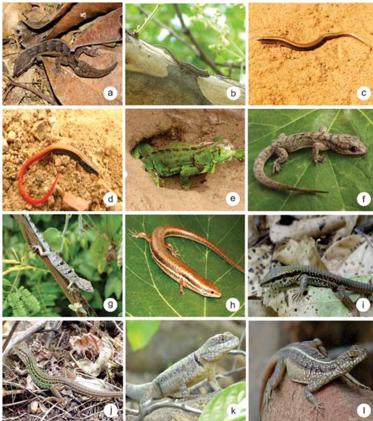
Figura 2. Algumas espécies de lagartos registradas em habitats de caatinga do Campus Ciências Agrárias da Universidade Federal do Vale do São Francisco, município de Petrolina, estado de Pernambuco, nordeste do Brasil. a) Hemidactylus brasilianus ; b) Lygodactylus klugei ; c) Nothobachia ablephara ; d) Procellosaurinus erythrocerus ; e) Iguana iguana ; f) Phyllopezus pollicaris ; g) Polychrus acutirostris ; h) Brasiliscincus heathi ; i) Ameiva ameiva ; j) Ameivula ocellifera ; k) Tropidurus hispidus ; l) Tropidurus semitaeniatus .