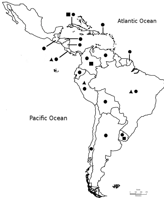
Figure 2. Distribution of B. coli in Latin America. ● = human cases; ■ = pig cases; ▲ = other hosts.

RAMÍREZ-AVILA, 2008), and their direct life cycle.