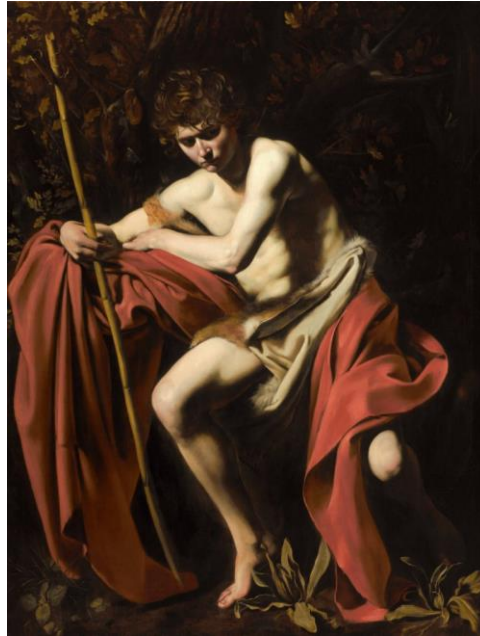
Imagen 1: Juan Bautista (Caravaggio, 1604).

Un elemento sumamente significativo de la pintura tenebrista es la combinación de luz y sombra. Las luces de este tipo de pintura únicamente logran ser tan exaltadas gracias a que las sombras son igual de intensas 4 .