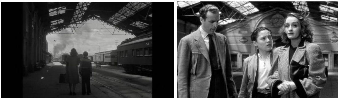
Imágenes 12 y 13: Estación de trenes Buenavista. Stills de Distinto amanecer.

De la misma manera retrata las vecindades del centro histórico, con sus carencias, son espacios donde las familias con escasos recursos habitan, se pueden observar que son espacios amplios donde hay muchas casas pequeñas unidas por escaleras de baldosa y paredes aplanadas con humedad por el tiempo, y en su interior con la cantidad mínima de muebles y elementos para subsistir, de igual forma se pueden encontrar las sombras como elemento repetitivo en la película, al igual los claroscuros que son un referente directo del cine negro.