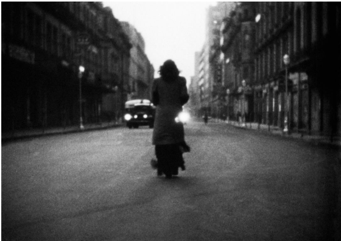
Imagen 7: Avenida Pino Suárez en Distinto amanecer .

Así, por ejemplo, el primer clásico noir del cine mexicano Distinto amanecer , donde el cabaret, la política, los ideales traicionados, el amor, la recuperación de la pasión perdida, la presencia del cubano Kiko Mendive, el afamado edificio Guardiola, la Casa de los Azulejos, la antigua estación de trenes de “El Mexicano” ubicada en Buenavista, una tenebrosa avenida Pino Suárez en la madrugada, son la representación de la ciudad como personaje dentro de un clásico. La película nos muestra una ciudad de hábitos nocturnos, estridente y trepidante, saturada de humo de tabaco y de arrabal; la genuina jungla de asfalto gris donde los personajes son capaces de todo, sin importar el precio por conseguir sus objetivos.