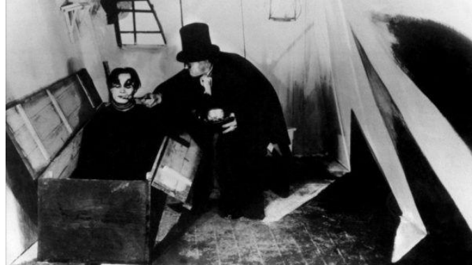
Imagen 4: Still de El Gabinete del Doctor Caligari .

representada en uno de los principales exponentes del expresionismo alemán en el cine, El Gabinete del Doctor Caligari (1920), de Robert Wiene.