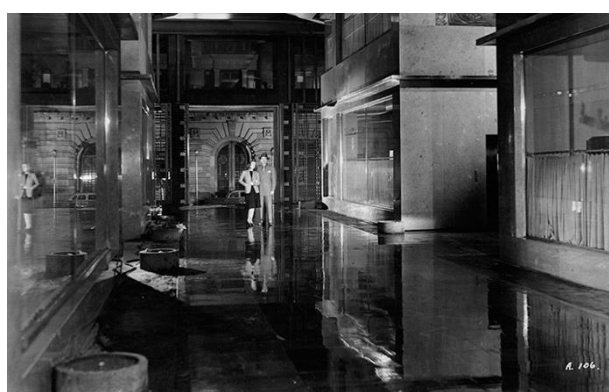
Imágenes 8 y 9: Calle de un barrio de la Ciudad y el Banco de México. Stills de Distinto amanecer.

El realismo del noir es una convención de la ficción y un espejo de las calles, ya que representa la ciudad desde su imaginario colectivo. Por ello, el uso del blanco y negro en el cine negro porque que manifiesta más los estados morales y anímicos, esculpiendo una figuración que fácilmente se va a dejar seducir por el subjetivismo, en su coqueteo con el onirismo o con los estados de embriaguez que la misma ciudad produce.