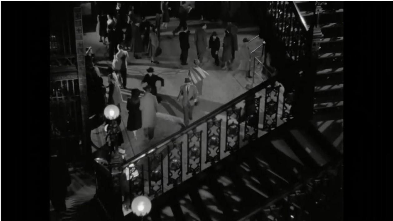
Imagen 14: Edificio de correos de México. Still de Distinto amanecer.

La ciudad como escenario es indispensable para el género negro en el cine y así como en la literatura, es uno de los elementos fundamentales para la construcción del género desde su origen en Estados Unidos. La ciudad representa la vida misma, el movimiento, el cambio, la modernidad.