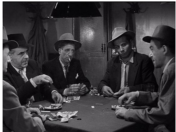
Imágenes 2 y 3: Los comedores de patatas (Van Gogh, 1885); y Rififi (Jules Dassin, 1955).

Se puede observar en las dos imágenes, en la pintura de Van Gogh, y en el fotograma de la película; Rififi (1955), a los jugadores que son remplazados por los miembros de una familia, la partida por una cena y el cuartucho por una cocina miserable.