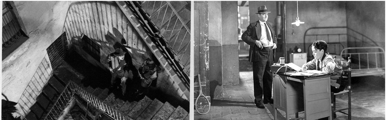
Imágenes 10 y 11: Exterior de una vecindad y interior de una vecindad. Stills de Distinto amanecer.

De la misma manera retrata las vecindades del centro histórico, con sus carencias, son espacios donde las familias con escasos recursos habitan, se pueden observar que son espacios amplios donde hay muchas casas pequeñas unidas por escaleras de baldosa y paredes aplanadas con humedad por el tiempo, y en su interior con la cantidad mínima de muebles y elementos para subsistir, de igual forma se pueden encontrar las sombras como elemento repetitivo en la película, al igual los claroscuros que son un referente directo del cine negro.