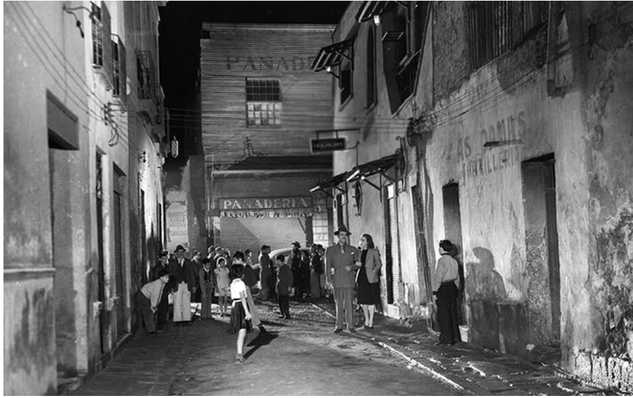
Imagen 5: Still de Distinto amanecer (1943).

El espectador del siglo XXI es un espectador más curtido y crítico, que ha experimentado y aprendido a leer las imágenes y está preparado, para distinguir la ciudad, no solo como un montón de edificios, y un espacio gris urbano, sino como un paisaje en el que se pueden revelar una serie de hechos sociales, culturales y políticos, que le proporcionen un contexto social, que enmarque una época, un suceso histórico, hasta un acontecimiento catastrófico, como el temblor del 85 en México.