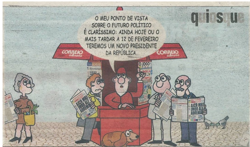
Figura 3: Cartoon da série quiosque, Correio da Manhã, 22/01/2006 (LEAL, 2011, anexos, p. 39)