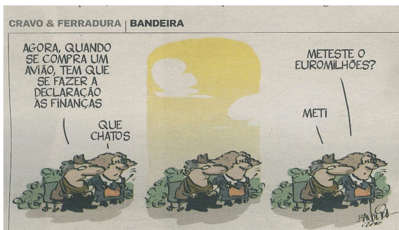
Figura 1: Cartoon da série Cravo & Ferradura, Diário de Notícias, 04/02/2006 (LEAL, 2011, anexos, p. 30)

Vejamos abaixo um exemplo desse gênero textual: