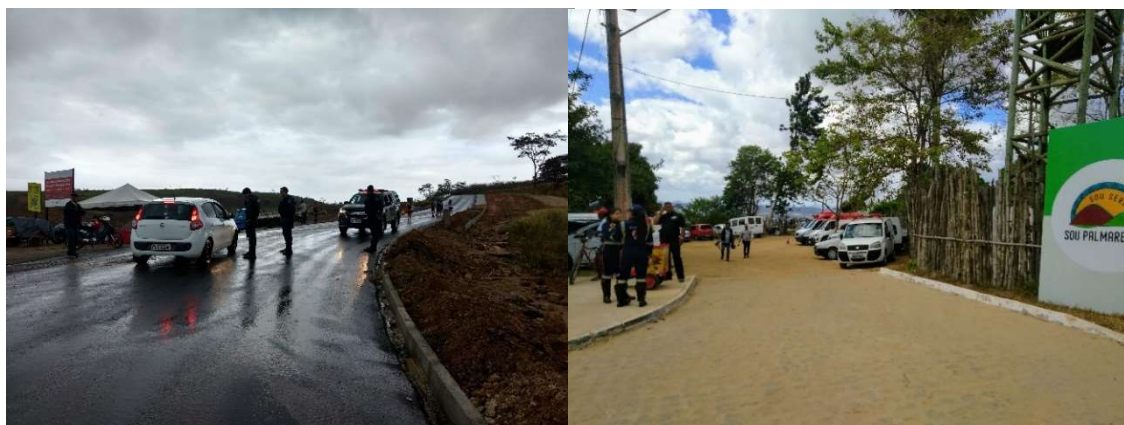
Imagens 9 e 10: Segurança e suporte de emergência no evento.

Como diria Carlos (2011, p. 11), o processo de produção espacial possui uma dupla e simultânea determinação: a objetivação humana no constructo da realidade concreta, e sua subjetivação ao tomar consciência acerca do processo e das possibilidades que lhe são ofertadas. Os agentes econômicos contribuem na modelagem do espaço, construindo um imaginário coletivo 28 . Gertler (2010) aborda sobre aredescoberta do social na produção , acoplando elementos sociais, apropriando-se da cultura, como lógica estruturante; em síntese, toda produção social refere-se ao processo que imprime materialidade, gerando formas.