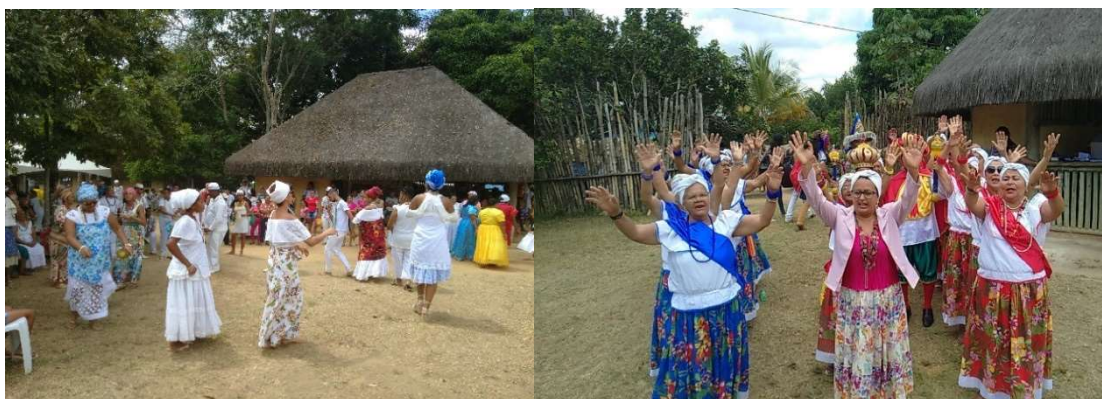
Imagens 13 e 14: Celebração.

No Zaratustra 31 há o relato poético de que a vida é uma canção carregada de angústia e sofrimento; Deus, segundo o filósofo, seria uma conjectura, projeção do homem que busca alívio. A frase marcante é do trecho Ler e escrever (2016, p. 52): “Eu só poderia acreditar em um Deus que soubesse dançar”. A carga pesada da vida é arrancada de sobre os ombros que já foram chicoteados; é por meio da festa que percebemos isso.