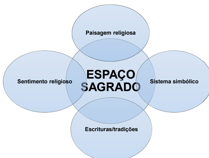
Organograma 1: Espaço sagrado e instâncias de análise. Baseado no livro Espaço Sagrado, 2008

Nas antigas sociedades orais agrárias 21 há três maneiras principais de possessão: a) espíritos do mal que são apaziguados por oferendas adequadas; b) um “deus”, um antepassado que momentaneamente se apresenta, fornecendo bênçãos e proteção; c) espírito que “consagra” um sacerdote ou intermediário para exercer determinadas funções representativas. Estes aspectos não têm relação nenhuma com o xamanismo de caça que negava a existência de divindades, ancestrais e até mesmo origens do mundo.