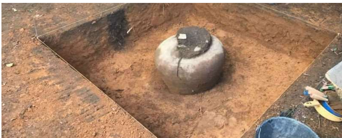
Imagem 6: Urna indígena encontrada na Serra da Barriga – AL.

Evidências assim, reforçam a ideia de que havia uma espécie de crença na sobrevivência dos que morriam. Na Serra da Barriga em União dos Palmares/AL, descobriram evidências arqueológicas similares: objetos como a urna funerária associada à tradição dos povos indígenas extintos Aratu, provando que antes mesmo dos africanos se estabelecerem no território do quilombo, já haviam indígenas, conforme a imagem 5 abaixo.