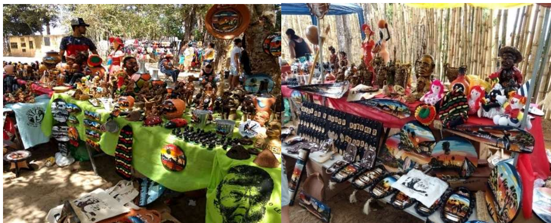
Imagens 7 e 8: dimensão econômica no espaço sagrado.

O evento nos proporcionou a oportunidade de conhecer concretamente sobre a cultura e a crença de matriz africana, religiosidade central nas celebrações do dia 20 de novembro; conversamos com líderes da religião e partícipes do evento e, registramos cada momento no local. Simplificando a questão, seguiremos ponto a ponto com as dimensões de análise.