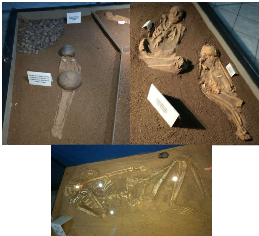
Imagens 3, 4 e 5: Fósseis pré-históricos em Xingó – SE.

ornamentação, cobrindo as partes consideradas como as mais sagradas. Tal exemplo pode ser visto na próxima página, nas imagens de uma visita que fizemos ao Museu de Arqueologia de Xingó – SE.