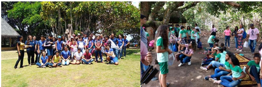
Imagens 17 e 18: alunos de uma escola pública local e alunos de uma escola pública visitante.

memorial do Quilombo, nem mesmo ao museu de Maria Mariá ou ao espaço da casa do poeta Jorge de Lima. Não se sentem vinculados aos maiores símbolos que constituem o lugar simbólico . Eles não têm nenhuma expressão de crenças 32 .