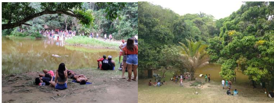
Imagens 15 e 16: visitantes em busca de lazer na lagoa encantada.

Rosendahl (2018) liga ao lugar o significado das práticas espaciais; todavia, o sagrado não é sagrado senão por meio da atribuição de uma consciência propriamente religiosa. E neste ponto, passa quase que despercebida uma quarta dimensão: lúdico-social . Quando me refiro ao lúdico-social, retomo a diversão e o agente que sobe o Quilombo dos Palmares, visita o espaço sagrado, assiste a dança, ouve as canções, compra mercadorias ofertadas no recinto, mas está ali apenas para se divertir, sozinho ou em família. E não é apenas neste evento que percebemos isso, mas em várias festas de padroir(a)os ocorre o mesmo, com o diferencial da instalação de um parque de diversões.