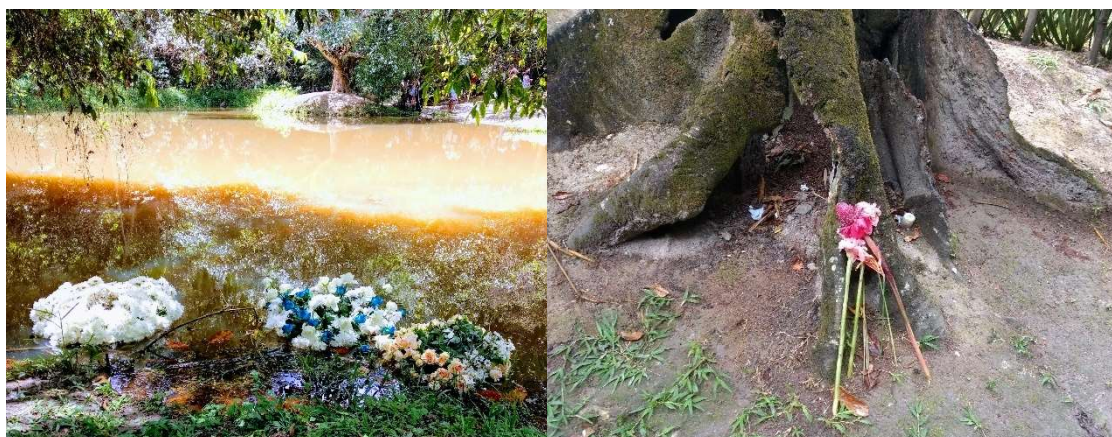
Imagens 11 e 12: Oferendas na lagoa e árvore sagradas.

O evento em si é um evento maravilhoso, é um evento que tem como passar muitas informações, sobre a ancestralidade , mas aí deixa muita coisa a desejar... como por exemplo, todo dia 20 a gente que, somos [SIC] da religião, passamos por várias dificuldades pra vim aqui pra fazer todo ritual , pra fazer oferenda à Zumbi, que é aos ancestrais, que é aos outros que participaram aqui, que viveram... e é um constrangimento muito... muito forte que a gente passa, e outra coisa: até uma hora dessa estamos aqui num sol desse esperando as autoridades, que eu acho que é uma falta de respeito também com a gente da religião e... sempre é a mesma coisa. E todos os anos se repete a mesma coisa e a gente tá aqui. Eu acho que poderia melhorar. Melhorar... melhorar não no sentido de dizer: ficou melhor! Pra o melhor mesmo! Não só pras autoridades, mas pra todo o grupo, todo o pessoal da matriz africana [...] 30