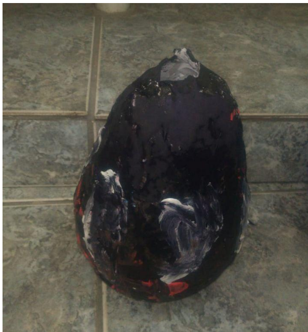
Imagem 5 - Vaso das almas do submundo dos alunos F. e P. do 5º ano.

Descrição dos alunos que produziram a ânfora: “O nosso vaso é só de uma coisa muito sombria: Hades, o deus do submundo.” Também nesta produção, agora do 5º ano, a dupla fez uma referência bem direta a um dos mitos narrados.