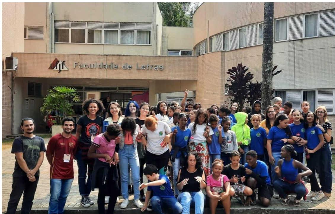
Imagem 13 - Foto dos alunos dos 6º anos acompanhados das professoras das turmas, da vice-diretora da escola e dos bolsistas do projeto.