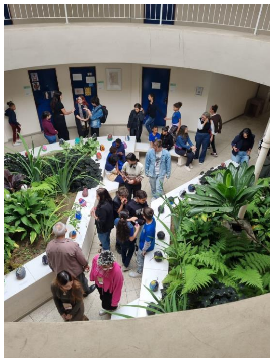
Imagem 7 - Imagem aérea de visitantes (membros da comunidade escolar e participantes do evento) apreciando a exposição