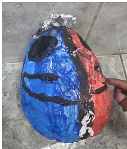
Imagem 3- Ânfora das emoções dos alunos R. e D. do 6º ano.

Cada dupla ficou totalmente livre para decorar sua ânfora com a única ressalva de que a decoração precisava estar relacionada aos mitos que os bolsistas contaram ou algum outro mito greco-romano que já conhecessem previamente. Dessa forma, houve um incentivo para que revisitassem os mitos em suas memórias e os utilizassem nesse momento. E, por causa disso, eles puderam criar ânforas muito divertidas e criativas.