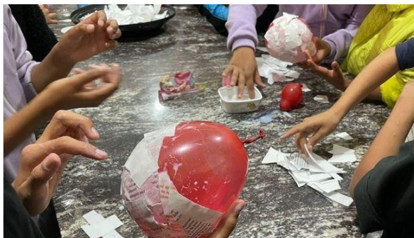
Imagem 1- Crianças colocando as camadas de papel machê nos balões.