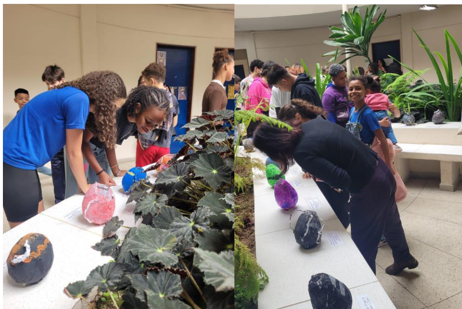
Imagens 8 e 9 - Alunos participantes do Projeto observando suas criações