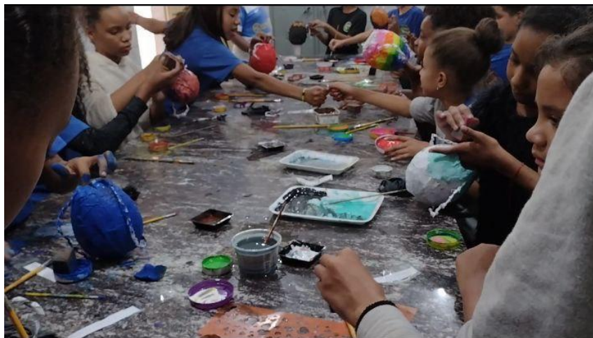
Imagem 2 - Alunos decorando as suas ânforas.