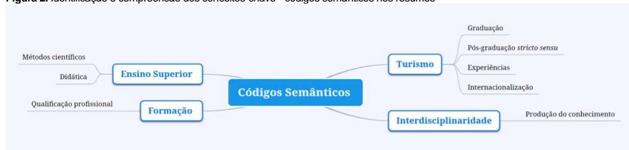
Figura 2. Identificação e compreensão dos conceitos-chave - códigos semânticos nos resumos

Durante a análise dos setenta e três (73) resumos foi possível identificar e interpretar a partir da revisão o entrelace de quatro (4) conceitos-chave 'códigos semânticos' que prevalecem em todas essas produções acadêmicas. Destaca-se que a partir da análise temática de Braun & Clarke (2006) com a construção do mapa mental a partir da teoria de Buzan (2009) e o aplicativo Mindomo , o levantamento de interpretações semânticas que permitiu atender ao objetivo e tema central, conforme é apresentado na Figura 2 envolvendo palavras-chave, mas o destaque são os seguintes códigos semânticos: Ensino Superior, Turismo, Formação e Interdisciplinaridade, presentes em todos os resumos encontrados nos Anais da ANPTUR, na Divisão Científica denominada 'Formação e Pesquisa Científica', cujo grupo de trabalho (GT) designado foi 'Formação e qualificação para o turismo', entre os anos de 2005 a 2023.