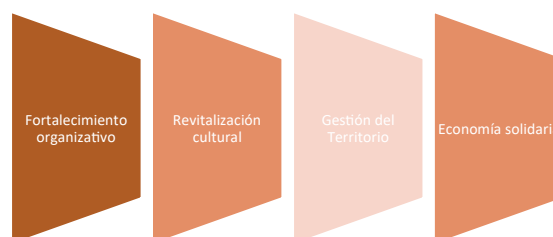
Figura 2. Ejes del turismo comunitario a potenciar.