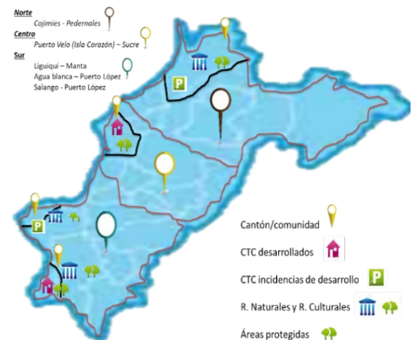
Imagen 2. Zonificación turística.

Cabe mencionar que, el principal interés de los actores involucrados es el de mejorar el sistema turístico, centrado en la productividad de cada comunidad y que esto, a su vez, permita el fortalecimiento organizativo y la asociatividad de las áreas en estudio; para lo cual, en la zonificación se comprenden cuatro áreas de integración, con la presencia de elementos naturales y culturales con alta potencialidad, tal como se muestra en la imagen 2.