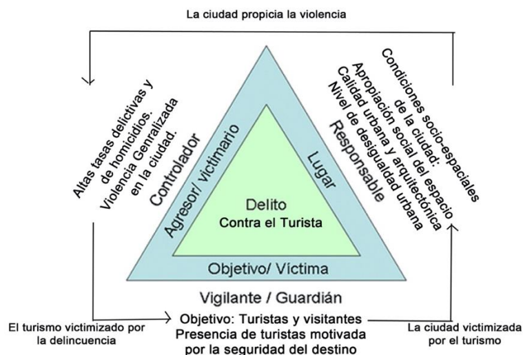
Figura 1: Esquema conceptual del delito contra los turistas.

Según Casgrain y Janoshka (2013) una buena parte de la gentrificación en América Latina se ha caracterizado por ser de tipo comercial vinculada particularmente con el turismo. Esa especialización de la ciudad conlleva a que la presión inmobiliaria haga muy difícil adquirir propiedades para vivienda sobre todo para poblaciones de baja renta. Por otro lado, ella genera una especulación inmobiliaria en la proximidad de los perímetros turísticos, donde aparecen edificios y terrenos vacantes en espera de ser vendidos o rentados a precios altos (Sigler y Wachsmuth, 2015). Esos vacíos urbanos pueden jugar igualmente en sentido negativo pues son propicios a la comisión de faltas ciudadanas y muestran según los términos de Newman (1972) la baja responsabilidad social sobre el territorio comunitario. Así se penaliza la permanencia de habitantes a la vez que se imposibilita la llegada de nuevos que servirían de control social a conflictos como la delincuencia.