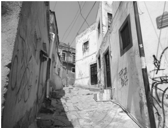
Foto 1: Vista general de los espacios de alta vulnerabilidad delictiva contra los turistas. Subida Cerro del Gallo.

El microanálisis de las condiciones arquitectónicas y urbanísticas en las áreas con mayor incidencia criminológica, mostró un importante grado de deterioro y/o abandono. De acuerdo con la matriz de evaluación, el 44% de los edificios que delimitan las áreas delictivas o puntos caliente, presentan un deterioro significativo en sus fachadas debido a pintura dañada, grietas en las paredes o falta de recubrimiento. Además, su estructura presentaba deterioro por falta de mantenimiento, como techos y paredes derruidas. En el espacio público se detectó otro indicador importante de deterioro, el grafiti y vandalismo contra edificios y espacios abiertos. El 65% de los edificios en las áreas con la mayor tasa de criminalidad contra los turistas están afectados por grafiti. También se detectó la acumulación de basura en las calles y la falta de depósitos para su recolección en el 56% de los puntos calientes de delincuencia contra los turistas. Cabe mencionar la proximidad o la existencia de edificios abandonados, vacíos urbanos o en “construcción especulativa” en el 85% de los puntos calientes.