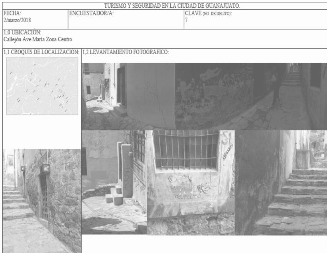
Figura 2: Matriz de evaluación espacial.