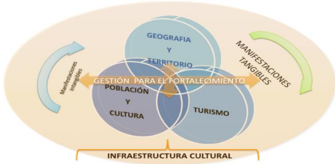
Figura 1 - Metodológica para el Análisis de la Política Pública Turística Cultural para Colombia.

socioeconómicas, para lograr la mayor satisfacción de los turistas y beneficios de las comunidades receptoras, con el adecuado manejo de los recursos naturales, humanos, materiales y financieros, para garantizar el desarrollo de las generaciones futuras, es decir, este modelo promueve el desarrollo sustentable. En la figura 1 se presenta de manera esquemática en La Propuesta Metodológica para el Análisis de la Política Pública Turística Cultural para Colombia.