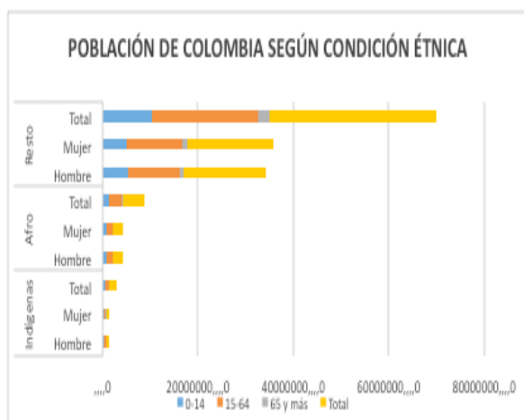
Gráfico 1: Población de Colombia según Condición Étnica

Los esfuerzos aún son insuficientes dada la diversidad cultural Colombiana, según el Departamento Nacional de Estadística – DANE, de acuerdo con el último censo de población del año 2005, existen, en Colombia, según la diversidad étnica 1.392.623 de indígenas; según el Ministerio de Cultura, distribuidos en 87 pueblos indígenas de los cuales, de los cuales 64 conservan aún sus lenguas nativas lo que corresponde al 3,4% de la población del país. Cerca de un 90% de esta población se encuentra distribuido en 704 territorios colectivos, delimitados y reconocidos legalmente y denominados en la legislación colombiana como resguardos, los cuales están localizados en 228 municipios y 27 departamentos. Como puede observar en la Tabla 1. de la Población indígena Colombiana.