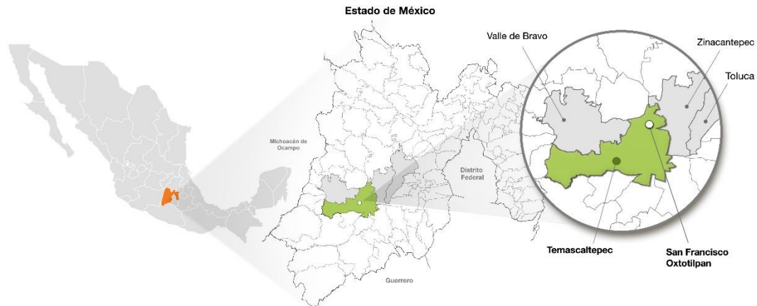
Imagen no. 1 Ubicación de San Francisco Oxtotilpan, Estado de México.