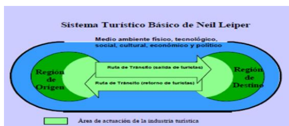
Figura 1: Sistema turístico básico de Neil Leiper.