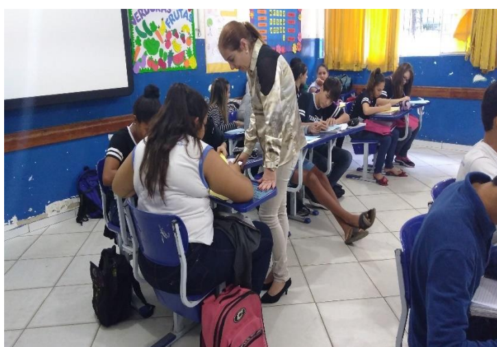
Figura 3. Momento de realização de atividade com a mediação da pesquisadora