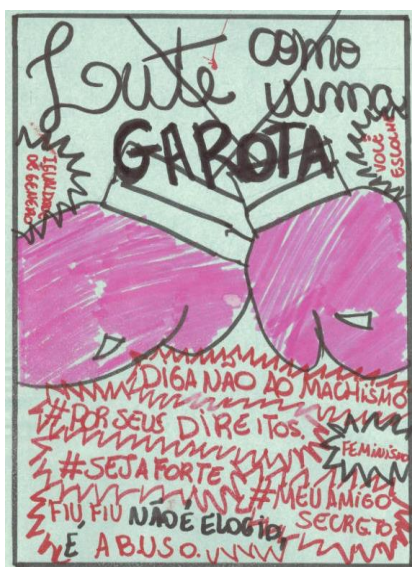
Figura 5. Panfleto elaborado por aluna no eixo VI