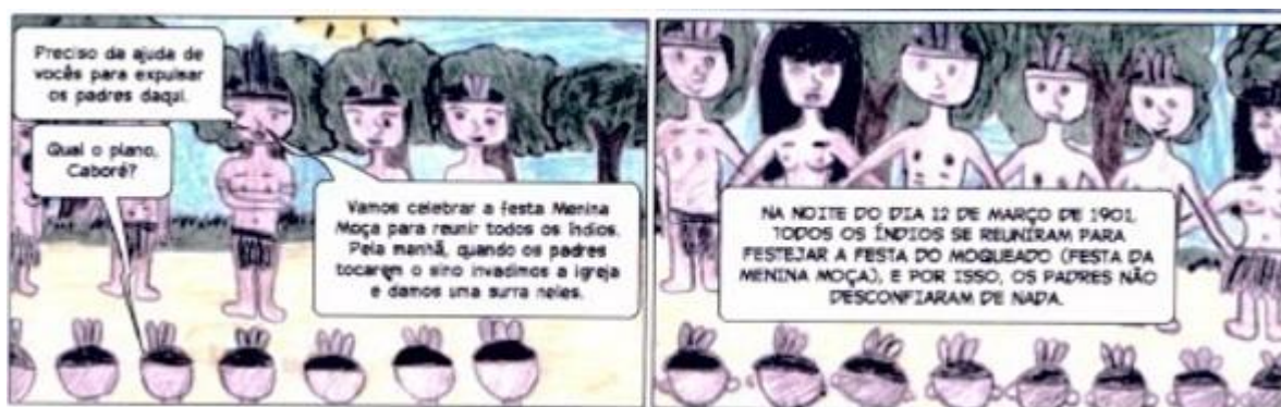
Figura 4. Trecho da Revista, 26º e 27º quadrinhos

Outra observação pertinente em relação à produção dos alunos, é que eles incorporaram no texto elementos próprios da cultura Guajajara, tais como: o ancião contando histórias ao redor da fogueira (1º quadrinho), a passagem da Festa da Menina-Moça (26º quadro), a transmissão da memória que passa de geração a geração (“... hoje vou contar uma história que meus pais me contaram e é passada de geração a geração” 1º quadrinho) e a utilização de adornos de penas. Isso revela uma ampliação dos conhecimentos sobre a cultura indígena, a qual não se restringe apenas à poligamia e à nudez, como pensavam no início da pesquisa.