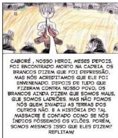
Figura 7. Trecho da Revista, último quadrinho

Por fim, e ainda analisando as vozes presentes no texto, concluímos que os produtores conseguiram implementar a fase de Avaliação, fase essa, que segundo Gonçalves (2010, p. 68), pode aparecer nos textos narrativos e trazer um julgamento ou posicionamento acerca da temática narrada. Além disso, os estudantes ao aceitarem a voz uníssona dos indígenas e concluírem que os Guajajaras não são maus, eles provocam o leitor, lançando mão de uma pergunta, a assumir um posicionamento diante dos fatos narrados.