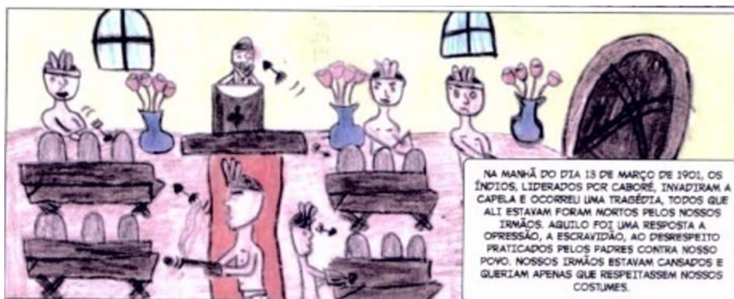
Figura 5. Trecho da Revista, 29º quadrinho

Numa análise sobre os aspectos linguísticos, verificamos que a história produzida é narrada em terceira pessoa e no tempo passado, exceto no primeiro quadrinho da Revista. Nessa, o narrador não apenas narra, mas conta e toma partido, emitindo quase sempre juízo de valor, como destacamos abaixo: