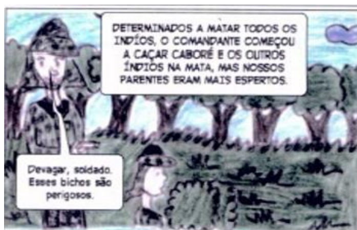
Figura 6. Trecho da Revista, 35º quadrinho

Essas e outras passagens textuais da revista não nos deixam dúvidas de que a voz e a perspectiva apresentada são as dos indígenas, o que mantém uma coerência espetacular com o título da produção e com a proposta da atividade.