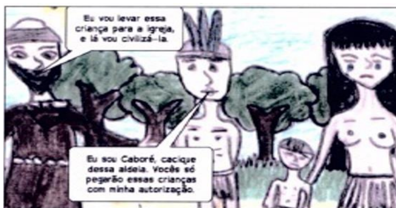
Figura 3. Trecho da Revista, 8º quadrinho

Sobre a caracterização da personagem principal – o indígena Caboré – vislumbramos que os estudantes a fizeram muito bem a partir da articulação entre as imagens e o texto escrito e da criação de ações que não foram narradas pelos informantes. Na Revista, Caboré, em sua primeira aparição na história, se apresenta como o cacique da aldeia, e, portanto, o responsável por prover a segurança de sua comunidade. O cacique frustra logo em seguida os planos dos padres de levarem as crianças indígenas para o convento da igreja.