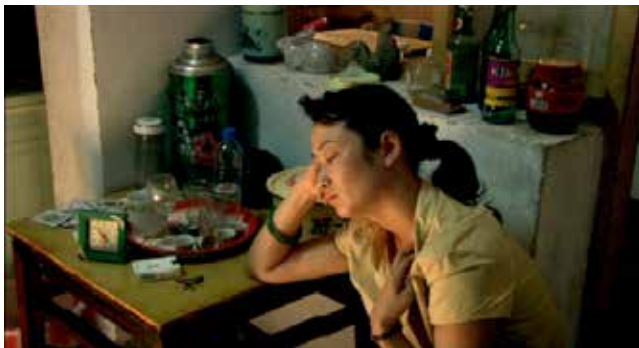
Espaço vazio em Em busca da vida .

Essa combinação de planos e movimentos de câmera, interligados por espaços vazios, também evidencia a presença aparentemente eterna de uma paisagem natural em contraposição à velocidade da mudança promovida pelo homem, em uma espécie de lamento cinematográfico pela perda da lentidão e da história. O desaparecimento de cidades e sítios históricos, portanto, parece também sugerir o desaparecimento de uma memória cultural e coletiva conectada a essa paisagem, e isso confere ao uso dos planos-rolô e das perspectivas múltiplas uma postura política. Em última análise, o que Jia parece sugerir é que a velocidade das mudanças em Feng Jie – e na China como um todo – é tamanha, que a história e a memória estão sendo inexoravelmente apagadas, destruídas. E que, diante desse cenário, suas escolhas estéticas deveriam necessariamente criar uma ponte entre a contemporaneidade e a história.