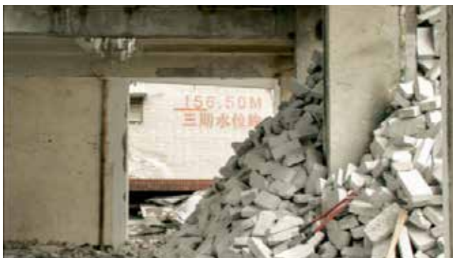
Em busca da vida e as Três Gargantas: paisagem imortal X cidade efêmera.

Não há dúvidas de que Jia Zhangke optou por situar essas duas histórias na efêmera cidade de Feng Jie, de modo a observar e refletir acerca da atmosfera de transformação intensa que domina não somente a região das Três Gargantas, como também grande parte de seu país desde os anos 1980. Essas mudanças são consequência da chamada Era das Reformas ( Gaige Kaifang , 1978-1992) de Deng Xiaoping, que levou a China em direção à economia de mercado. Sob a liderança de Deng, que sucedeu a década traumática da Revolução Cultural (1966-1976), o país passou gradualmente a cultivar melhores relações com o resto do mundo e a abrir sua economia para o investimento externo. Internamente, a China reverteu a coletivização da agricultura, privatizou grande parte da indústria e permitiu o aparecimento de negócios privados. Os efeitos das reformas econômicas foram sentidos com intensidade nos espaços urbanos do país que, desde então, vem passando por grandes transformações, com a