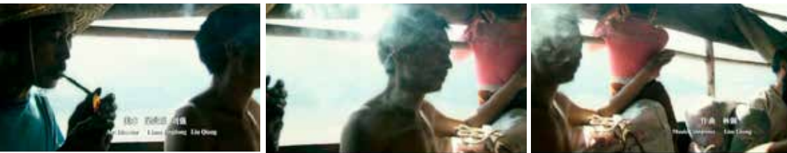
O plano-rolô em Em busca da vida .

das Três Gargantas. Combinados, os três recursos estéticos propiciam uma investigação sobre a relação entre a figura humana e seu ambiente, trazendo à tona a superimposição de temporalidades que caracteriza a cidade de Feng Jie e, em última análise, a China contemporânea.