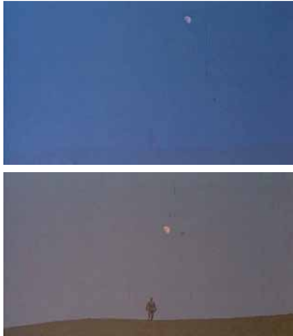
Planos de abertura de Terra amarela .

O fotógrafo e futuro diretor Zhang Yimou comentou, diversas vezes, sobre a importância simbólica da região na qual o filme foi realizado: trata-se do berço da civilização chinesa, remetendo, assim, aos tempos pré-históricos, atravessada por uma metáfora natural que é o Rio Amarelo, conhecido pelos chineses como o “rio mãe” (BERRY e FARQUHAR, 1994). Foi, portanto, de modo a transmitir toda a força e o significado dessa região, que Zhang e Chen escolheram lançar mão de técnicas normalmente associadas à tradição shanshuihua , como a proporção entre a natureza e a figura humana observada não apenas na sequência de abertura, como também em outros momentos no filme. No primeiro plano de Terra amarela , o homem parece, de fato, ser engolido pela magnitude da paisagem, e, desse modo, ele só poderá ser considerado em relação a essa paisagem.