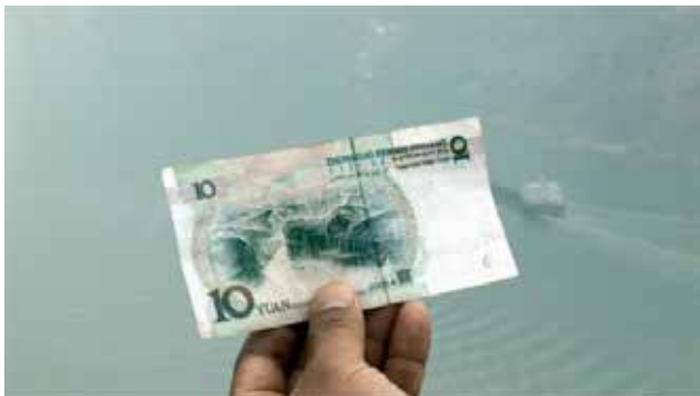
Kuimen, a nota de dinheiro e a figura humana em Em busca da vida .