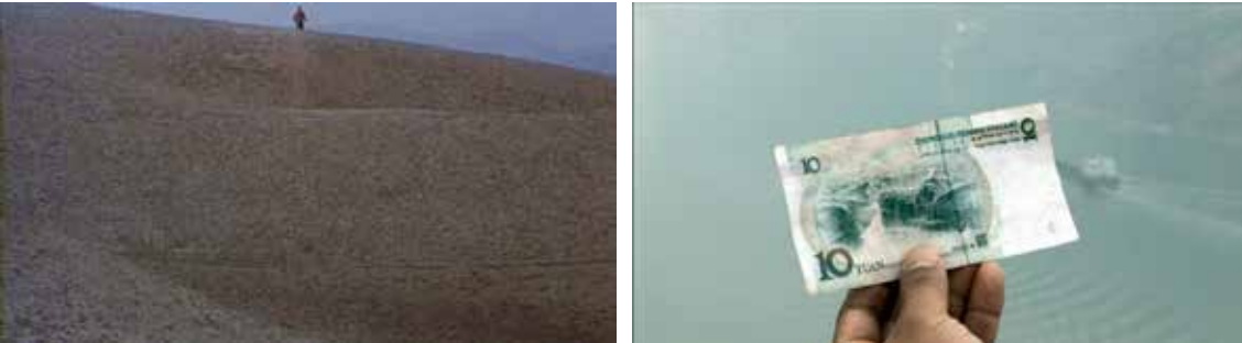
Homem-miniatura X Paisagem-miniatura.