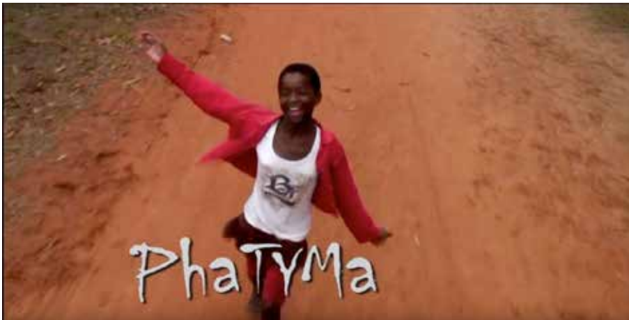
Figura 6 :: Capa do filme Phatyma , de Luiz Chaves e Pauline Chiziane

O segundo filme Phatyma (2010) foi exibido em São Paulo, no evento Respeito à Diferença: conhecendo melhor os refugiados , em Maio de 2016, no Centro Cultural Jabaquara. Esse evento foi produzido pelo Grupo de Refugiados e Imigrantes Sem Teto (GRIST) e trouxe a questão do país africano Congo, imerso em uma guerra contínua devido à exploração de minérios que compõem a fabricação de celulares. Nessa realidade de guerra, entre as estratégias para enfraquecer a população local estão estupros de mulheres e meninas, o saqueamento de comunidades e o apoio dos EUA aos países vizinhos para a manutenção do estado de guerra, mantendo o domínio no preço de venda do minério. Neste caso, o próprio contexto de visionamento já estava marcado por inúmeros conflitos, com vários pedidos de apoio a divulgação da situação do Congo e uma solicitação formal para que a guerra no local pare, foi denunciado ainda o papel dos países europeus que permanecem em conchavo com os dirigentes dos países em conflito, um poder pós-colonial que não se destrói. Especificamente em relação ao Congo, trata-se da Bélgica e da França, mas nos demais países africanos como essa relação se mantém?