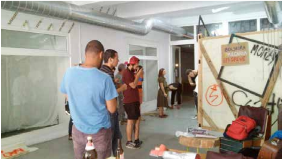
Figura 2 :: Registro da montagem da cabine