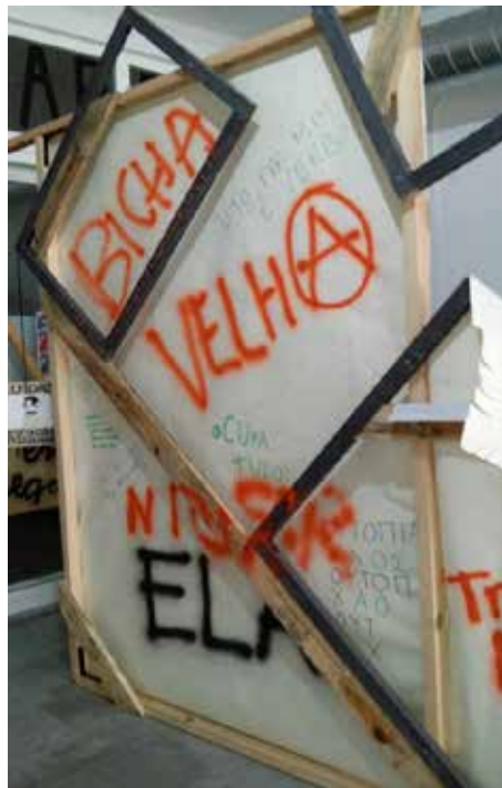
Figura 3 :: Lateral da cabine de exibição