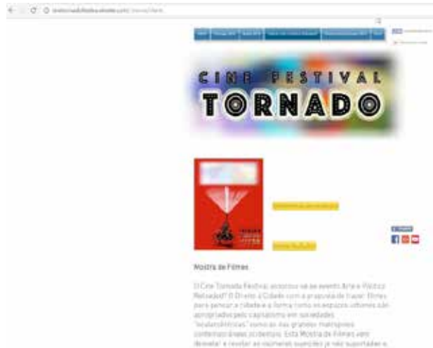
Figura 8 :: Imagem do cartaz e catálogo da mostra no CTF

Quanto a divulgação no site do Cine Tornado Festival e na página do evento no Facebook, sobre essa exibição em particular, revelou maior variação, inicialmente foram 58 likes , no dia anterior a exibição no ISCTE-IUL, para 219 likes , com a postagem das fotos do evento no ISCTE-IUL. Essa grande variação parece ter ocorrido em função de muitos participantes estarem envolvidos nas atividades de performance e de deslocamento e, quando tiveram tempo para aceder as informações, então, curtiram e comentaram as fotos. As postagens do Facebook não foram impulsionadas, ou seja, contaram apenas com a rede direta dos pesquisadores, artistas e coletivos envolvidos na produção. Datam de 12 de Junho de 2016 as últimas postagens referentes à exibição no ISCTE-IUL, quatro dias após o evento.