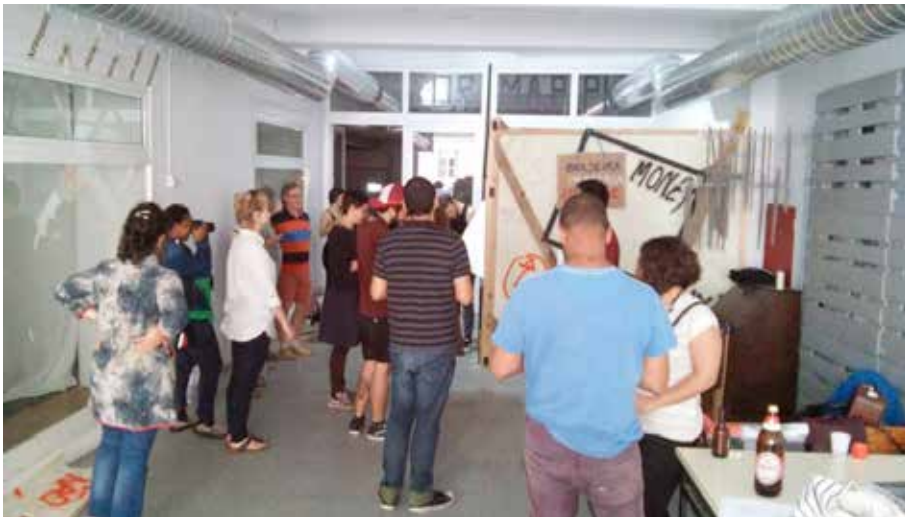
Figura 1 :: Montagem da cabine de exibição de filmes no Espaço da Penha, em Lisboa

No primeiro espaço, os participantes puderam inscrever suas motivações artísticas nas paredes da cabine, com capacidade média de três lugares, as cadeiras eram ocupadas conforme o fluxo de interesse, de modo rotativo e inconstante. A proposta com esse modelo de exibição foi a sensibilização aleatória, ou seja, independente da composição dos filmes, cada um deles bastaria para gerar pensamentos questionadores e reflexivos e uma eventual conexão entre os filmes teria um caráter mais fugidio. Nesse espaço, a cabine foi construída pelos participantes das oficinas, transeuntes que passavam no local e os organizadores, entre os dias 5 e 6 de Junho de 2016. No dia 7 do mesmo mês foram exibidos mais de 60 filmes, entre curtas, médias e longas-metragens, em sistema de pull – ininterrupto – a partir das 9h da manhã até às 6h da tarde. Simultaneamente, nesse mesmo espaço cultural havia na programação outras atividades, que ora ocorriam dentro do Espaço Cultural da Penha – onde se localizava a cabine –, ora no espaço público próximo. Eram palestras; vivências experimentais; instalações; debates sobre casos reais de exclusão social e descaso das autoridades, relacionados ao processo de gentrificação das cidades.