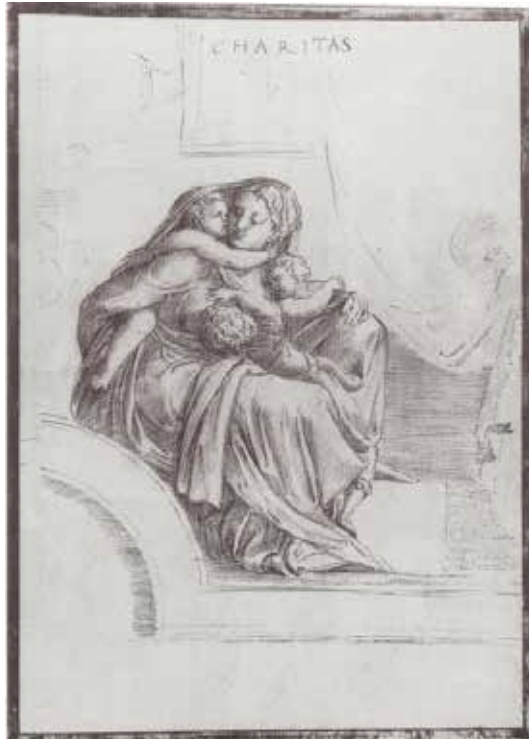
Figura 3 :: A alegoria da caridade. Francisco de Holanda.

arquitetônico esboçado ao fundo. Joaquim de Vasconcellos (1896, p. 6) comenta que, antes dele, Tubino havia levantado a possibilidade de o desenho de Francisco ser uma cópia de uma miniatura de Júlio Clóvio, onde figurava uma alegoria da caridade vista por Francisco de Holanda. O episódio está narrado no quarto dos Diálogos em Roma .