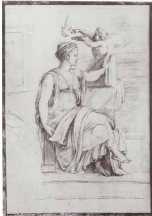
Figura 2 :: Sibila Eritreia . Francisco de Holanda.

como letras, as quais, transpondo-as: S. O. PH., seriam lidas como Sofia – a Sabedoria.