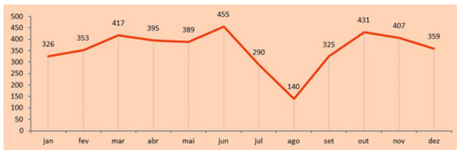
Figura 1. Evolução do número de atividades artístico-culturais ativas enunciadas nas Agendas Culturais de Lisboa — 2015 ao longo do ano (n.º)

Um primeiro aspeto a salientar prende-se com o número e distribuição das atividades artístico-culturais apresentadas nas Agendas Culturais de Lisboa ao longo do ano de 2015. A partir das agendas analisadas, podemos adiantar que o número de atividades se mantém ao longo de quase todo o ano, com um valor superior às 300 atividades, registando-se os picos mais significativos nos meses exatamente anteriores e posteriores ao período das férias de verão (455 em junho e 431 em outubro).