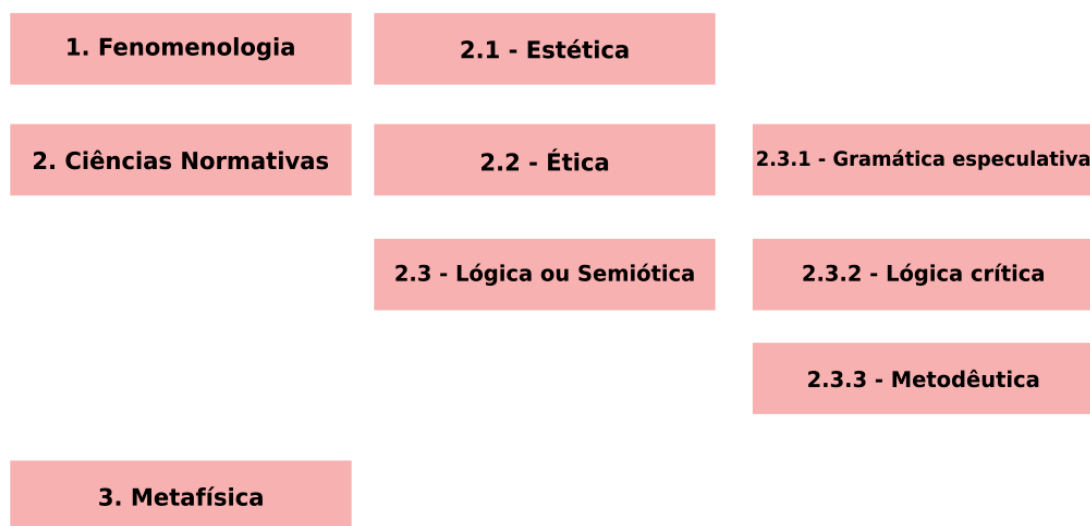
Figura 1 - Diagrama da arquitetura filosófica de Peirce.