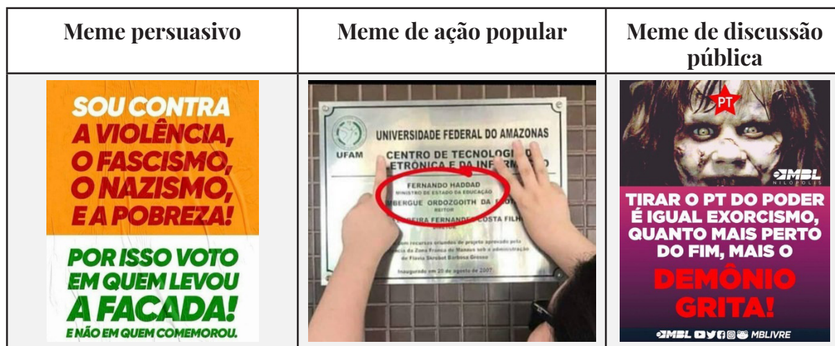
Quadro 1 - Tipologia de memes aplicados à amostra dos dois candidatos