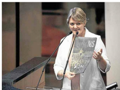
Figura 2: Nota no Diário Catarinense de 6 de julho de 2017.