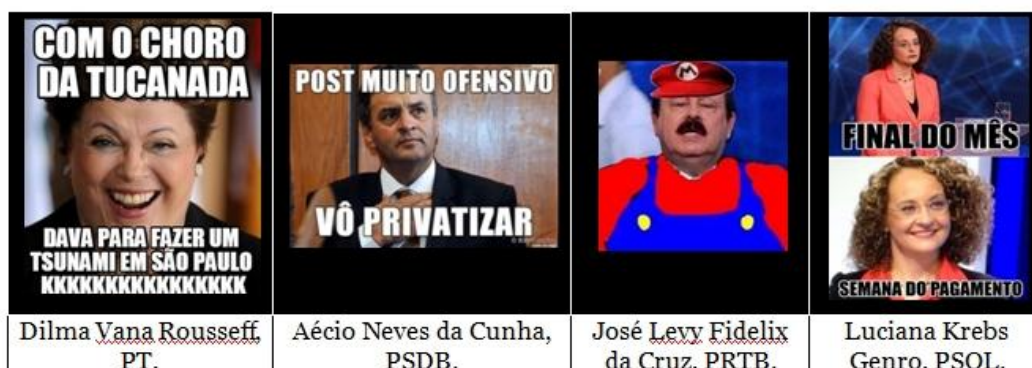
Figura 1 - Memes dos candidatos compartilhados nas redes sociais digitais durante a eleição presidencial em 2014.

Essas reproduções, batizadas de memes, apresentavam apelos divertidos e de conotação crítica à política nacional.