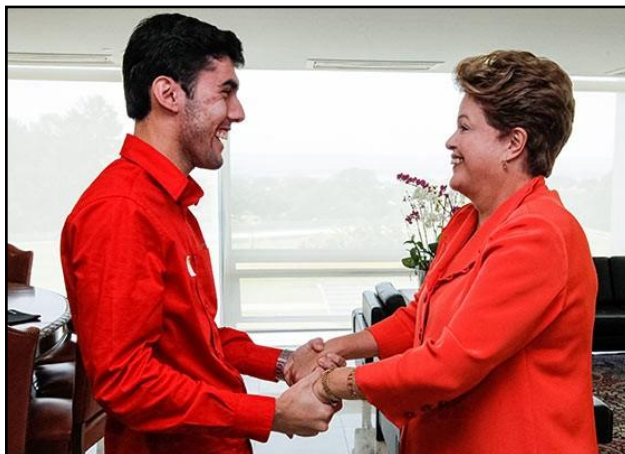
Figura 8 - Agência contratada pelo PT paga R$ 20 mil de salário a criador de Dilma Bolada.