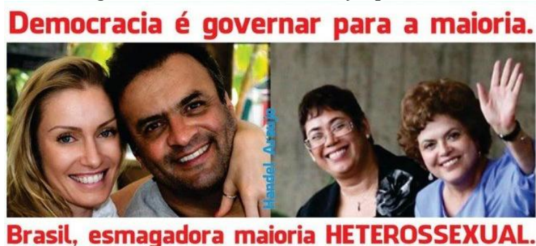
Figura 6 - Meme divulgado na internet durante a eleição presidencial em 2014.

Orientando-se pelos estudos de Junior, Santos e Vergili (2014), é possível elucubrar que esses conteúdos imagéticos estão ligados umbilicalmente com as práticas nefastas do Astroturfing , pois são amplamente divulgados nas redes sociais digitais, sem autenticidade e evidenciando interesses políticos que utilizam claramente a violência para contaminar a opinião pública em benefício de um ideal espúrio conforme é destacado na figura abaixo: