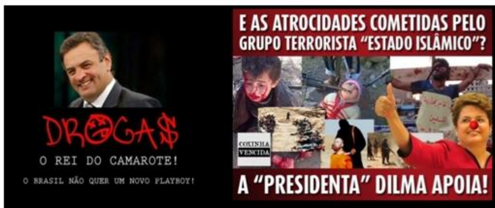
Figura 2 - Memes violentos utilizados contra os candidatos que disputaram o 2º turno da eleição para presidência do Brasil em 2014.

Todavia, concomitantemente à produção dessas representações, insurgiram memes com apelos que agrediam, violentamente, os candidatos à Presidência da República.