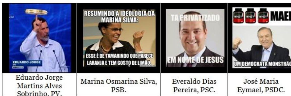
Figura 4 - Memes dos candidatos compartilhados nas redes sociais digitais durante a eleição presidencial em 2014.

Entretanto, os memes imagéticos – constituídos por imagens, fotografias ou ilustrações disponíveis na internet – são os mais concebidos e compartilhados pelos internautas, devido à praticidade de sua elaboração, pois consistem na criação ou apropriação de imagens, manipuladas com o uso de softwares de edição gráfica, recebendo aplicações de legendas com apelos cômicos que concatenam a narrativa visual desses conteúdos, consoante a figura abaixo: