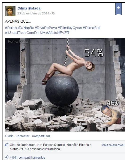
Figura 7 - Milhares de curtidas e compartilhamentos de um meme postado pelo perfil falso da candidata a reeleição Dilma Vana Rousseff, durante a disputa eleitoral em 2014.