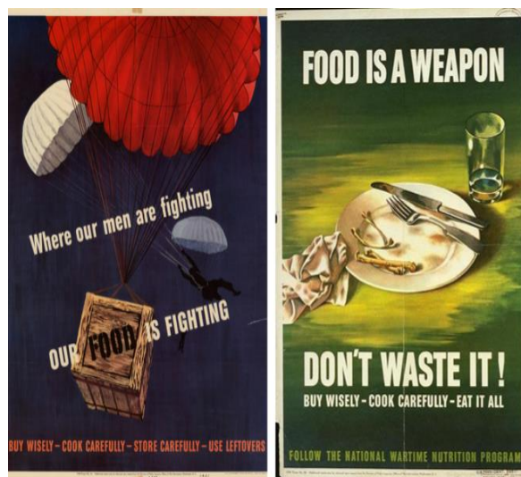
Fig. 15: Office of War Information. 1943. Where our men are fighting, our food is fighting : buy wisely--cook carefully--store carefully--use leftovers. UNT Libraries Government Documents Department. https://digital.library.unt.edu/ark:/67531/metadc551/m1/1/