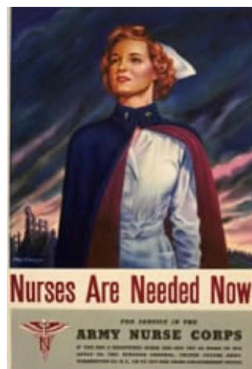
Fig. 8: United States Army Recruiting Publicity Bureau, 1944. Steele Savage Nurses are Needed Now! For Service in the Army Nurse Corps. Library of Congress Prints and Photographs Division Washington, D.C. https://www.loc.gov/item/90712791/

A medida que se intensificaba la participación de Estados Unidos en el conflicto mundial, las mujeres civiles fueron animadas a ocupar puestos también en el frente, especialmente como enfermeras –función compatible con el rol de cuidadoras tradicionalmente atribuido a las mujeres (Figura 8). Es necesario recordar que ya existían en la Women Airforce Service Pilots (WASPs) mujeres activas combatiendo como pilotas de aeronaves de guerra 8 . Así lo recordaba también un artículo publicado en las ediciones en lengua portuguesa y castellana del Reader's Digest , en agosto de 1943. Como siempre, el artículo había sido publicado meses antes en la edición estadounidense 9 . Bajo el título “Mujeres en paso de Marcha”,