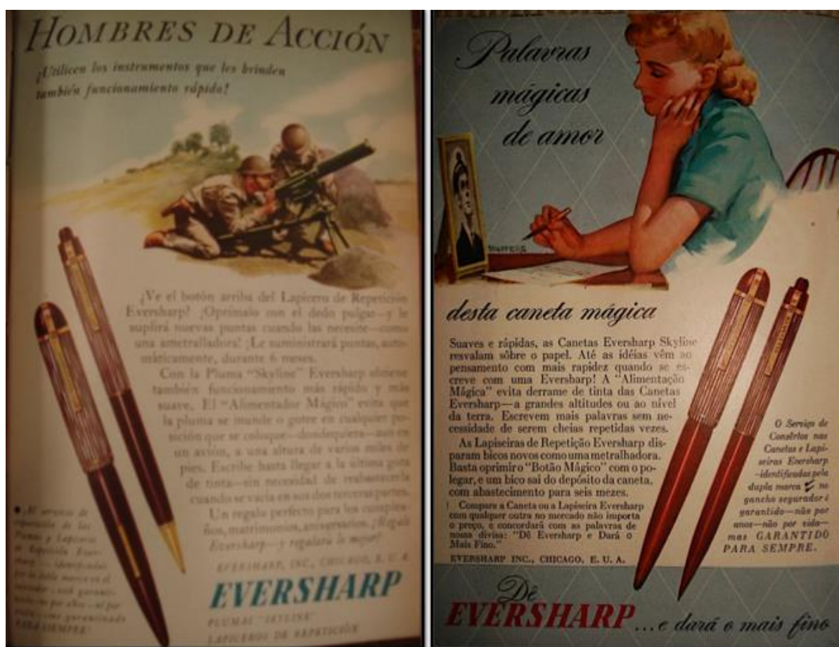
Fig. 17: Seleções , versión brasileña, mayo de 1942. Páginas publicitarias, sin numeración.