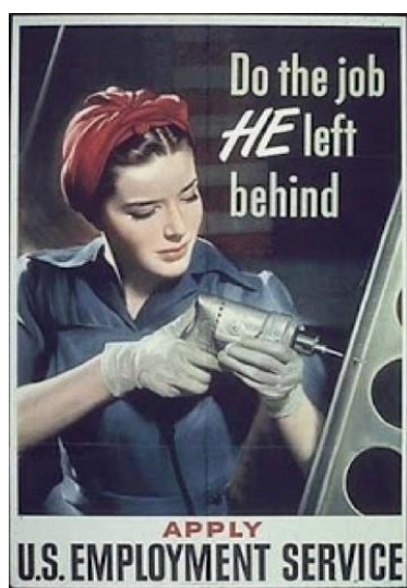
Fig. 3: Office for Emergency Management, 1943. Office of War Information. Domestic Operations Branch. R. G. Harris, Do The Job He Left Behind , Bureau of Special Services. 3/9/1943-9/15/1945. National Archives and Records Administration. https://catalog.archives.gov/id/513683