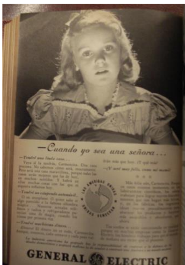
Fig. 19: Selecciones , versión en castellano, marzo de 1943. Páginas publicitarias, sin numeración.