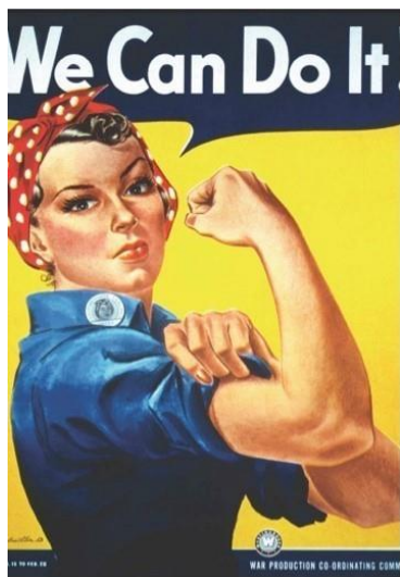
Fig. 1: War Production Coordinating Committee, 1943. Westinghouse Electric Corporation; J. Howard Miller, We Can Do It! . National Museum of American History. https://americanhistory.si.edu/collections/search/object/nmah_538122