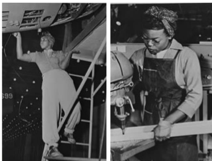
Fig. 10 e 11: California, 1942. Trabajadoras en fábrica de aviación militar.