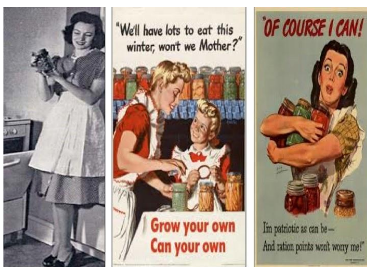
Fig. 12: Office of War Information, 1943. A woman shows off a jar of canned beans. Food Conservation. , Oregon State Nutrition Committee. Folder 18, Box 28, Defense Council, OSA. https://sos.oregon.gov/archives/exhibits/ww2/Pages/services-nutrition.aspx .

La propaganda de guerra dirigida a las mujeres estadounidenses contemplaba también a aquellas que tendrían que quedarse en casa cuidando de hijos pequeños. Estas eran desestimuladas –aunque no prohibidas- a trabajar. Las esposas de los combatientes, por ejemplo, recibían una ayuda del gobierno de cincuenta dólares mensuales, más un extra de 20 dólares por cada hijo (Tuttle JR 2004, 63). Una variedad de carteles de propaganda estimulaba a las amas de casa a economizar alimentos, dada la enorme demanda de proteínas necesarias para la alimentación de los soldados. Al mismo tiempo, una intensa campaña estimulaba el cultivo de los llamados Jardines de la Victoria, para la producción de hortalizas y verduras destinadas a la elaboración de conservas caseras para abastecer el hogar (Imágenes 12 a 14) 11 . Con eslóganes que conectan las áreas doméstica y cívica, las amas de casa son instigadas a economizar alimentos: “Soy todo lo patriota que puedo. Los racionamientos no me preocupan” (Figura 14).