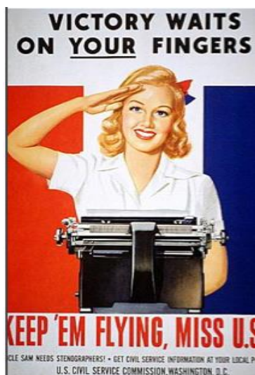
Fig. 7: Office of War Information, 1945. Victory Waits On Your Fingers - Keep 'Em Flying, Miss U.S.A. Records of the Office of Government Reports, Record Group 44; National Archives at College Park, College Park, MD. https://www.docsteach.org/documents/document/victory-waits-on-your-fingers