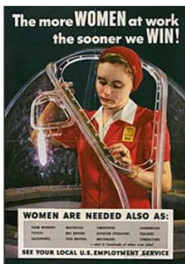
Fig. 5: U.S. Government Print Office, 1943. The more women at work the sooner we win! U.S. Employment Service.

Power , de la Office of War Information, iniciativa del gobierno estadounidense que ocasionó la entrada de un número sin precedentes de mujeres al mercado de trabajo, remuneradas o no. Su participación en la producción de aviones de guerra mereció ser destacada en las páginas de la popular revista estadounidense, el Reader's Digest 6 . Las ediciones latinoamericanas publicaban un artículo a ese respecto en agosto de 1942 7 .