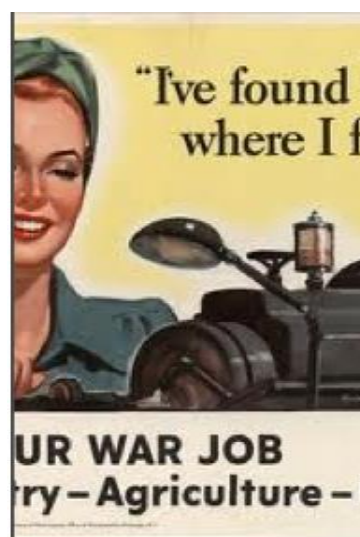
Fig. 6: Office of War Information, 1943. Roeppe, George, I've found the job where I fit best! find your war job in industry, agriculture, business. Library of Congress Prints and Photographs Division Washington, D.C. https://www.loc.gov/pictures/item/90707072/