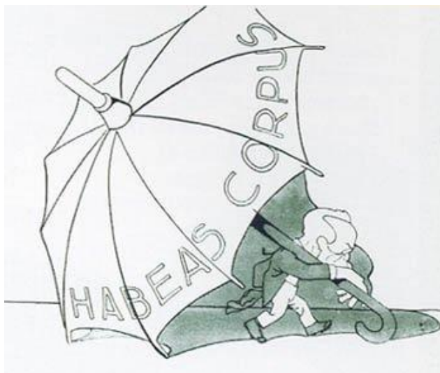
Figura 1: Charge retratando Rui Barbosa como um par constante do habeas corpus .

defesa do direito de locomoção. Terminava, assim, o período que ficou conhecido como doutrina brasileira do habeas corpus .