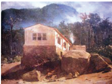
Figura 3: Fábrica do Barão de Capanema , óleo sobre cartão, 52 x 35 cm, c. 1862, MNBA.

Uma composição totalmente diferente aparece em Fábrica do Barão de Capanema (Fig. 3) 17 , em que o primeiro plano mais claro e vazio dá destaque à construção elevada sobre pedras no centro da tela, sendo a perspectiva barrada por um fundo mais próximo, constituído por montanhas e vegetação mais escuras. Logicamente a própria mudança de tema justifica a diferença de composição, mas me chama a atenção o fato de a representação da fábrica ser feita totalmente sem presença humana, sendo a arquitetura muito mais um acidente na paisagem. Além disso, é notório o distanciamento do caráter de paysage composé , em uma tomada que parece permanecer muito mais próxima da tomada ao natural, como as experiências dos paisagistas de Barbizon – mais um ponto a ser aprofundado em pesquisas futuras.