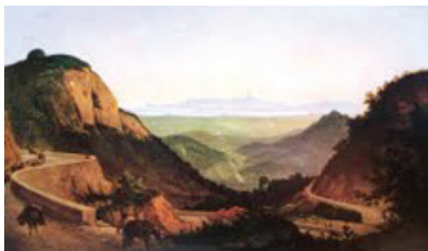
Figura 1: Paisagem do Rio de Janeiro , óleo sobre tela, 78,5 x 130, 1857, Coleção Teófilo Estefno, São Paulo.

Apesar da importância destas representações da flora brasileira, aqui gostaria de enfatizar mais as paisagens de Agostinho José da Mota. Tanto em Paisagem do Rio de Janeiro (Fig. 1) 15 , quanto em Vista do Rio de Janeiro (Fig. 2) 16 são vistas distanciadas da cidade, estruturadas de forma semelhante: a metade superior da tela é ocupada pela apresentação do horizonte longínquo, com a baía e o céu em cores mais claras; já a metade inferior é tomada pelos morros e vale, em coloração mais escura, sendo o primeiro plano mergulhado em sombra, sobretudo do lado direito. Na primeira, à maneira de Félix Taunay, há a presença de cavalos e figuras humanas diminutas, no primeiro plano da pintura, mas quase imperceptíveis. Já na segunda obra, não parece haver presença humana de todo, a luz destacando, sobretudo, o casario, em especial o aqueduto. Mas todas duas remetem à paisagem clássica francesa, renovada no século XIX a partir de Vallenciennes e que Motta acessou, a partir de seu mestre Benouville: enfatizam o cuidado com a composição, criando um padrão idealizado de representação da paisagem e, sobretudo, a segunda destaca a importância da luz.