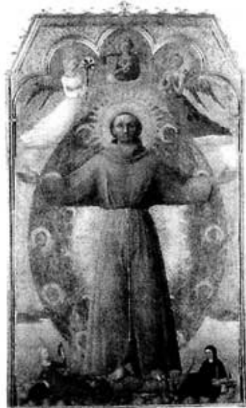
Figura 4 - Sasseta, Franciscus alter Christus , 1437-1444. Têmpera sobre madeira, 122 X 195 cm, Coleção Berenson, Settignano.