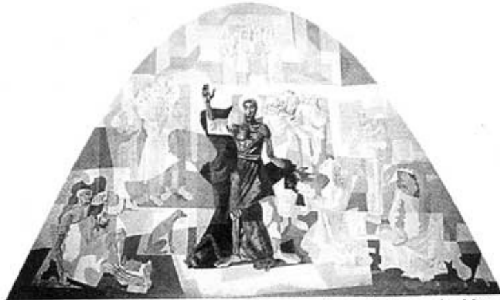
Figura 3 - Cândido Portinari, São Francisco Despojando-se das Vestes , 1945. Pintura mural a têmpera, 750 X 1060 cm, igreja de São Francisco de Assis da Pampulha, Belo Horizonte.