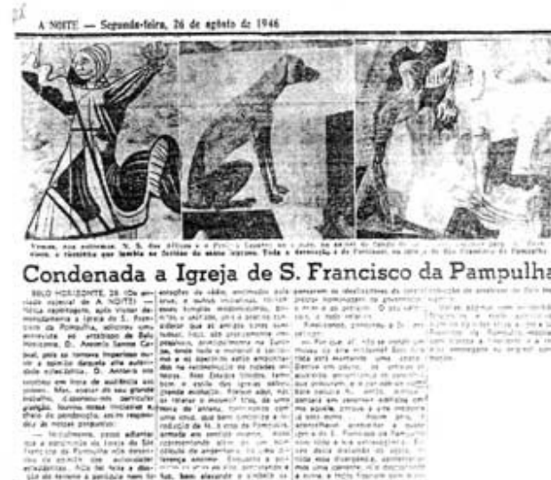
Figura 2 - 'Condennada a Igreja de São Francisco da Pampulha'. Rio de Janeiro, A Noite, 26 agosto 1946.