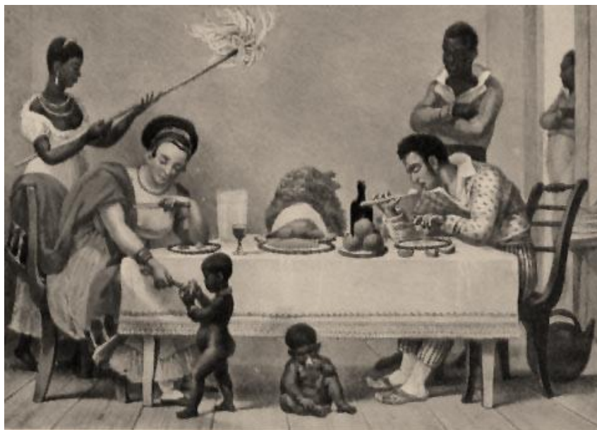
Figura 2: Um jantar brasileiro

constantes no álbum iconográfico, estão presentes: desde a figura dos índios e dos elementos da natureza, o cotidiano da cidade do Rio de Janeiro, bem como o convívio das famílias dos barões do café e os negros, até a suntuosidade da corte Portuguesa. Suas aquarelas, apesar do alto valor histórico, demonstram que sua produção, foi altamente influenciada pela imagem que se queria construir do novo império. Dentre os temas que a obra revela, no quadro Um jantar brasileiro , temos a cena de um jantar de uma família branca, rodeada por escravos, a servi-los, enquanto a mulher branca se entretém com os filhos da mulher negra, aos pés da mesa posta.