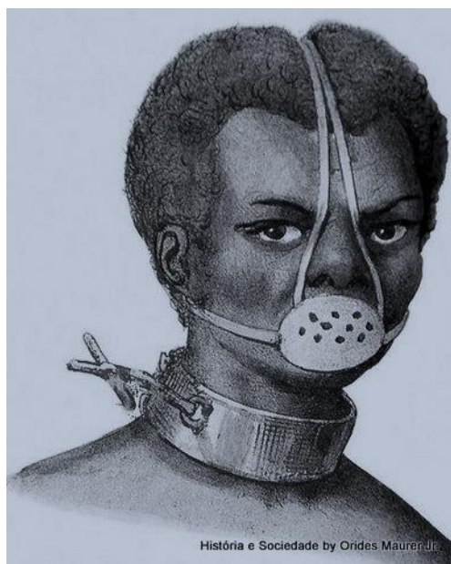
Figura 3: Castigo de escravo - máscara de flandres

A ilustração de Jacques Etienne Arago, que nos serve de base ao nosso raciocínio, retrata um castigo cruel e humilhante que se impunha aos negros e às negras, escravizados e escravizadas, para silenciá-los e silenciá-las, além de realçar a relação de poder estabelecida. A percepção desse silenciamento no âmbito da escrita da História macro e maiúscula, pautada em binarismos fechados e homogêneos, esteve ancorada numa visão andro-euro-etno-judaico-cristã-fono-falocêntrica , e cunhou a Modernidade etnocêntrica europeia.