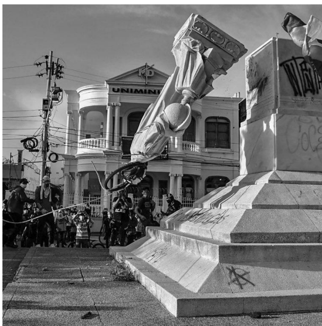
Figura 4: Derrubada da Estátua de Colombo

A imagem de Mery Grandos Herrera, da Agência AFP, que retrata um grupo de manifestantes colombianos derrubando uma estátua do navegador e explorador italiano Cristóvão Colombo, em Barranquilla, na Colômbia, em junho de 2021; nos serve, em alegoria conclusiva, de base para ilustrar a derrocada das hierarquias etnocêntricas, ante ao surgimento das Epistemologias do Sul.