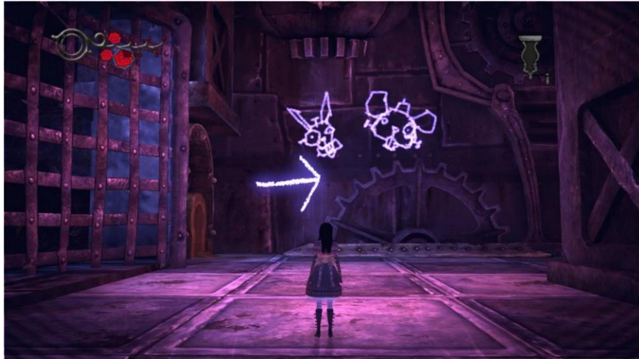
Figura 2. Somente após encolher, Alice consegue acessar mini -portas e visualizar dicas para qual caminho seguir nas paredes em Alice: Madness Returns.