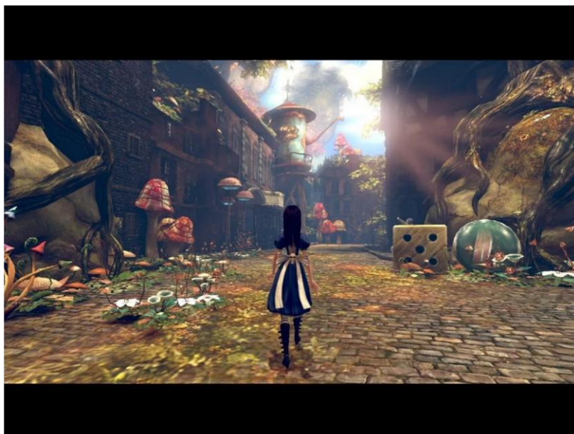
Figura 3. Fim de jogo. Alice anda nas ruas de Londres, que agora se misturam harmoniosamente com o País das Maravilhas de sua mente.

Isso também se inclui nesse panorama da cultura de convergência, onde as grandes empresas veem nos produtos diversificados de mídia um meio, também narrativo, propício para expandir o que não puderam fazer em somente uma mídia. Sendo assim, o que não é possível fazer em um filme de duas horas pode ser explorado em um jogo de videogame por mais 30 horas. Complementando-se a isso, criam-se comunidades virtuais dispostas a resolverem enigmas não solucionados nos jogos ou em séries de televisão, tais como Lost , por exemplo. Essa multiplicidade de territórios por onde as histórias podem percorrer é vista, agora, com o advento das novas tecnologias, como uma realidade presentificável, apesar de ainda estarem dentro das telas, tal como realidade simulada e/ou virtual. Com isso, os próprios suportes passam a ser multifuncionais. Um telefone celular não mais se atém à sua função primária, que é a de fazer ligações; bem como um livro (que já era uma zona de convergência per se , tal como pode-se perceber, por exemplo, no caráter hipertextual dos livros ilustrados ou não-ilustrados) pode conter funções que remetam a um jogo de tabuleiro,