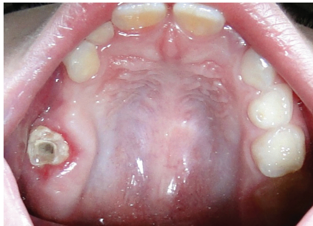
Figura 2: Vista oclusal do dente 16.