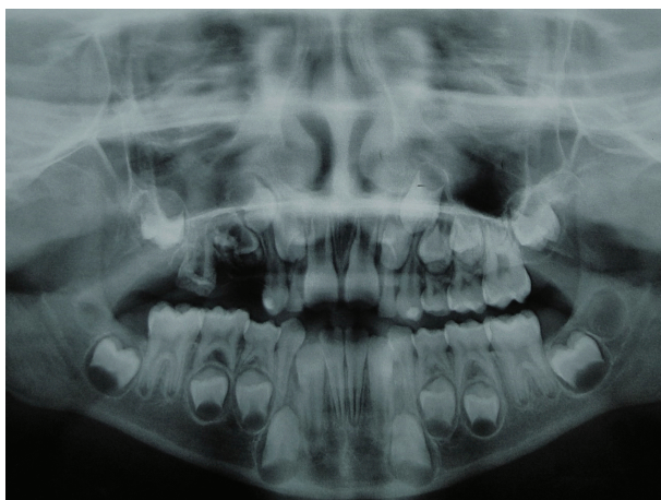
Figura 4: Radiografia Panorâmica.