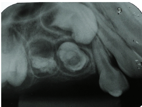
Figura 5: Radiografia periapical após 6 meses.

Diante disso, adotou-se o retorno do paciente a cada 6 meses para acompanhar a irrupção do dente 17, uma vez que os elementos dentários presentes nesta anomalia são malformados e, quando em meio bucal,