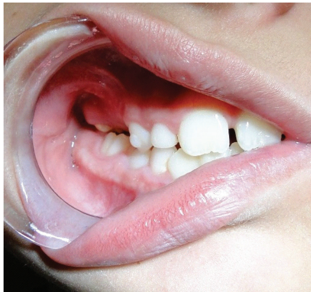
Figura 1: Vista da região maxilar direita.

fusionadas, curtas e com ápice aberto, características dessas determinantes da anomalia (Figuras 3 e 4).