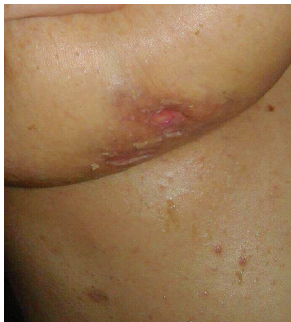
Figura 3: Lesões fistulares com saída de exsudato purulento nas regiões infra mamárias.

Na investigação inicial foi solicitada biópsia cutânea que evidenciou infiltrado de células histiocitoides na derme reticular, com eventuais eosinófilos. As células exibiam núcleos chanfrados, reniformes, com citoplasma eosinofílico pálido e eventual figuras de mitose (Figura 4). A imunohistoquímica revelou positividade para CD1a e S-100 confirmando diagnóstico de HCL (Figura 5).