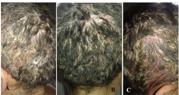
Figura 2: Placa com escamas aderentes aos pelos, espessa, difíceis de destacar, exsudativas, localizadas no couro cabeludo. A. Perfil lateral esquerdo. B. Região posterior de couro cabeludo. C. Perfil lateral direito.