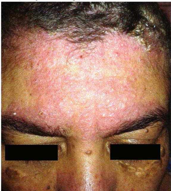
Figura 1: Placa eritemato infiltrada descamativa localizada na fronte.

Paciente, sexo feminino, 44 anos, portadora de diabetes tipo II e hipotireoidismo. Há 16 anos com descamação e prurido no couro cabeludo. Apresentou piora progressiva dessa lesão que evoluiu para placas com escamas aderentes aos pelos, espessa e exsudativas (Figura 1), além de acometimento da fronte e dorso nasal (Figura 2), fístulas e exsudação nas regiões axilares, inframamárias (Figura 3) e virilhas. Fez uso de talidomida e metotrexato com melhora, porém reativação após interrupção do tratamento.