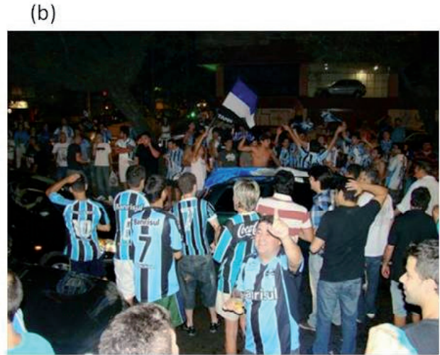
Figura 2 - (a) Torcedores comemoram na Av. Goethe em Porto Alegre o título mundial. (b) Torcedores comemoram vaga na Libertadores da América em Porto Alegre.

Quando ocorrem jogos nos estádios do Grêmio ou do Internacional verifica-se uma concentração de torcedores nos locais próximos aos estádios, ocorre a presença de vendedores ambulantes vendendo desde lanches até os mais variados produtos relacionados ao clube, exemplificados pela Figura 3. A partir disso, podem-se analisar as funções que a paisagem possibilita a partir do valor simbólico de um de seus