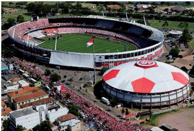
Figura 4 - (a) Estádio Olímpico. Fonte: www.gremio.net . Acesso em 21 de outubro de 2011. (b) Estádio Beira-Rio. Fonte: http://www.internacional.com.br . Acesso em 21 de outubro de 2011.