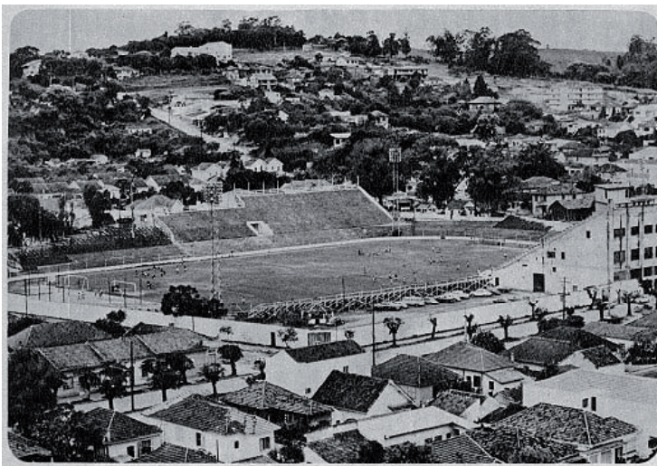
Figura 6 - Estádio dos Eucaliptos.