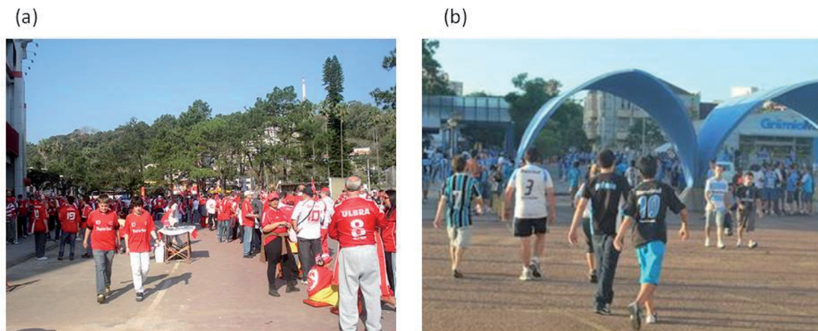
Figura 1 - (a) Concentração de torcedores e vendedores ambulantes próximos ao estádio Beira-Rio. Fonte: http://globoesporte.com . Acesso 21 de outubro de 2011. (b) Torcedores do Grêmio no pátio e arredores do Estádio Olímpico. Fonte: http://www.lancenet.com.br . Acesso 21 de outubro de 2011

O futebol é um elemento do cotidiano da população e está presente nos mais diferentes locais, sendo praticado por diversos grupos de pessoas, sendo importante para a identidade brasileira, sobre isso se observa que