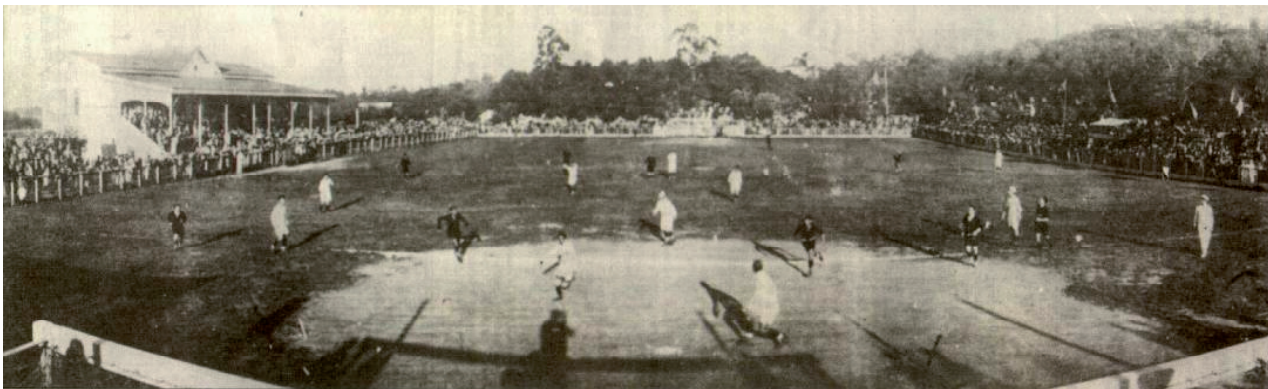
Figura 5 - Foto histórica de jogo na Baixada. Fonte: www.gremio.net . Acesso em 21 de outubro de 2011.