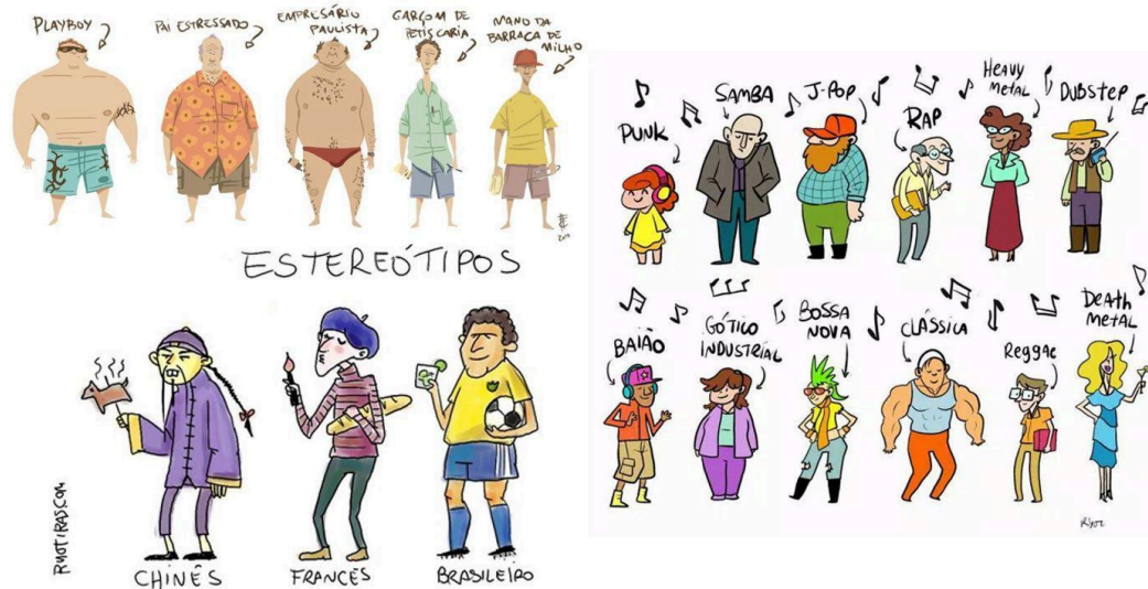
Figura 3 – ilustrações para discussão em grupo (aula 3)