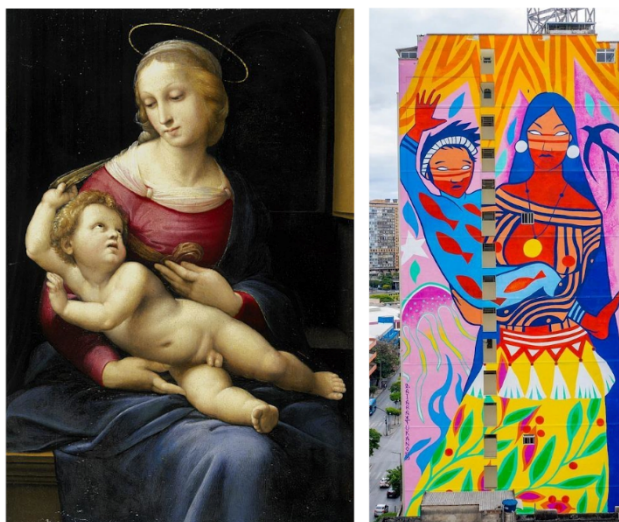
Imagem 8. Montagem: “Bridgewater Madonna” e “Selva Mãe do Rio Menino”, respectivamente

Fonte: SANZIO, 1507. Óleo sobre tela transferida de um painel. Disponível em: < encurtador.com.br/klAS1 > Acesso em 20 de abril de 2022 e TUKANO, 2020. Grafite, acrílica em alvenaria. Disponível em: < https://pbs.twimg.com/media/Eqej_7xW8AAD7bF.jpg > Acesso em 20 de abril de 2022.