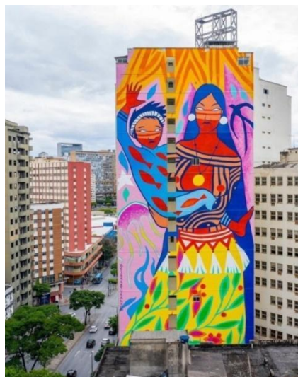
Imagem 3. “Selva mãe do rio menino”

Fonte: TUKANO, 2020. Grafite, acrílica em alvenaria. Disponível em: