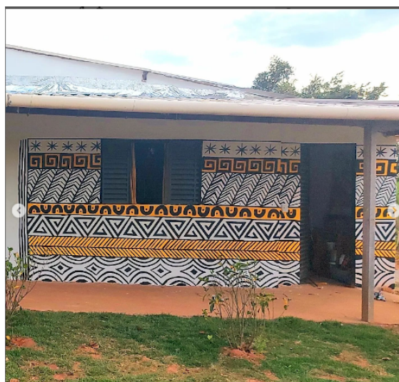
Imagem 4. Mural na casa de Daiara Tukano

nossa casa com meus irmãos” 72 . Com isso, observa-se que há um duplo reforço da tradição originária de seu povo, tanto pela prática muralista, quanto pelo tema abordado.