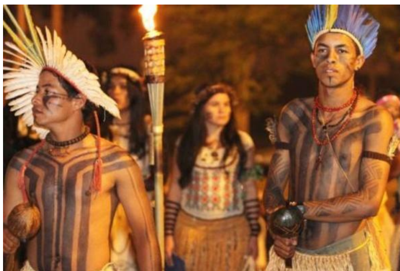
Imagem 6. Pintura corporal da etnia Xakriabá