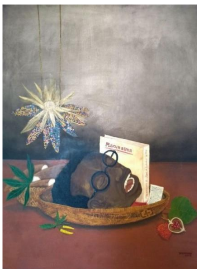
Imagem 1. “Re-Antropofagia”

Fonte: BANIWA, 2018. Técnica Mista. Disponível em: