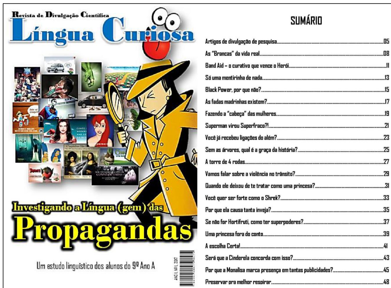
Figura 4 – Capa e sumário da RDC Língua Curiosa

Assim, a constituição do novo gênero se deu tal qual acontece nos contextos reais das práticas de linguagem: com a língua em atividade, moldando-se e transformando-se por meio de interações. Visando-se a uma produção que teria um público leitor genuíno, ele decorreu de leituras e compreensões de gêneros variados; da necessidade de os estudantes se informarem, posicionarem-se criticamente e de registrarem suas percepções; resultou ainda, principalmente, de vivências escolares que extrapolaram as práticas tradicionais. Por isso, apesar das dificuldades, a UD agregou muito à formação dos alunos e também da professora pesquisadora. O resultado foi a revista composta por 20 artigos de constituição peculiar, que focalizaram propagandas e anúncios publicitários de diversas temáticas.