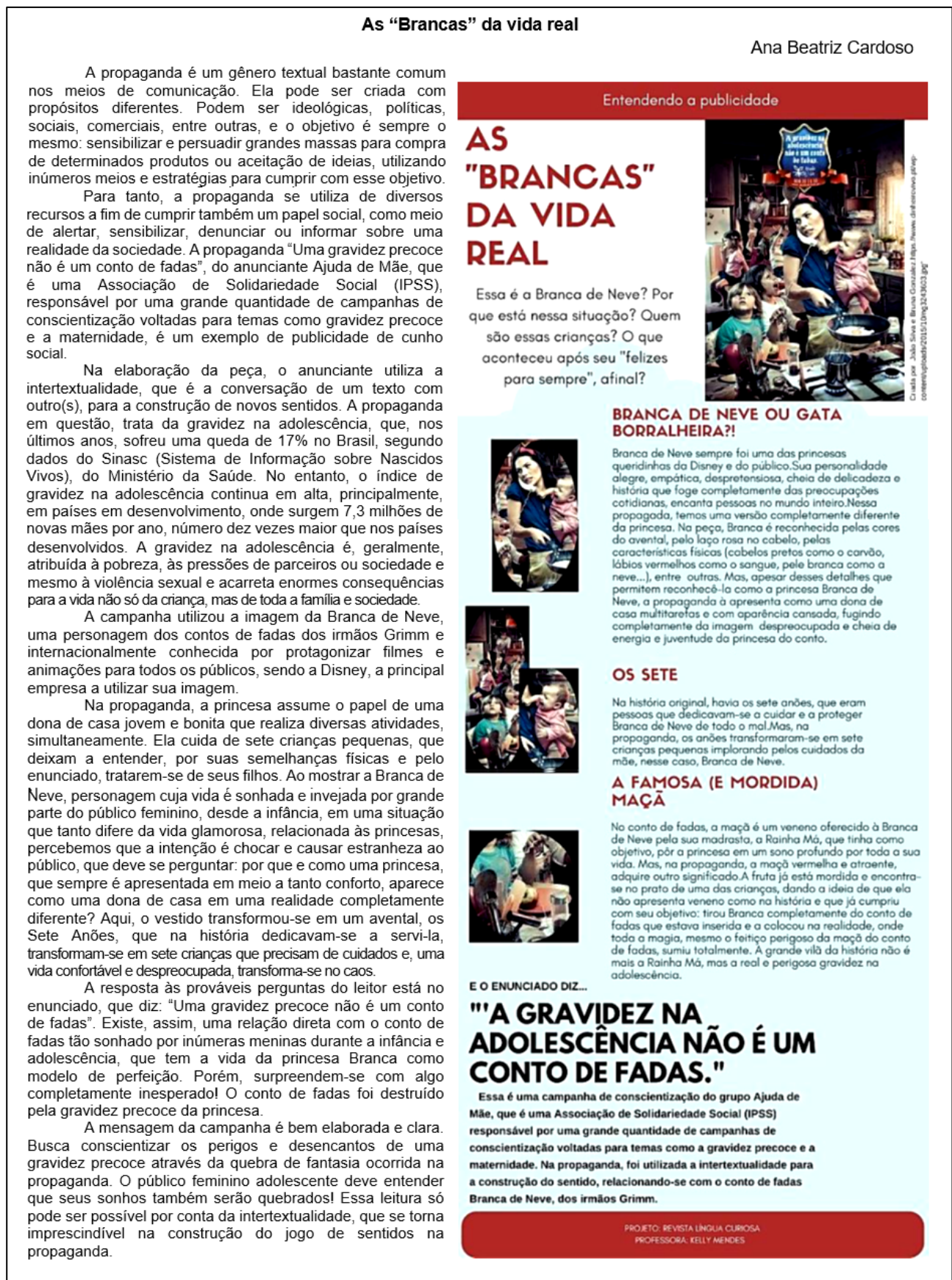
Figura 3 – Exemplo de ADC