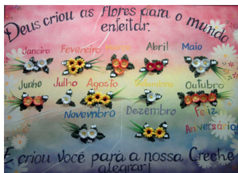
Ilustração 3. Quadro de aniversariantes do mês

O discurso religioso abrangia a temática da valorização dos sujeitos, como pode ser observado nas Figuras 3 e 4. Nos murais de valorização dos sujeitos, o discurso religioso podia ser visto ora de maneira explícita, ora de maneira implícita. Os murais explícitos usavam enunciados típicos da esfera religiosa para valorizar os adultos, conforme mostra a Ilustração 3.