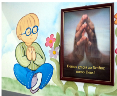
Ilustração 8. Imagem no corredor de entrada.

As fotos pareciam dialogar com as pinturas nas paredes da escola. Isto pode ser visto no corredor de entrada da escola. Havia ao lado da foto de duas mãos de adulto juntas, como se estivesse fazendo uma prece, a pintura de uma criança com as mãos juntas na altura do peito, como se estivesse orando, como pode ser visto na ilustração 8.