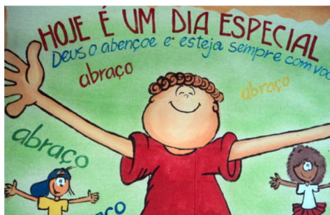
Ilustração 1. Mural em frente à sala das crianças de 2 e 3 anos

a mensagem de boas-vindas. A intenção era de mostrar aos responsáveis das crianças pequenas que a escola é um ambiente acolhedor e confiável, no qual podem deixar os filhos. Conforme pode ser visto na Ilustração 1: