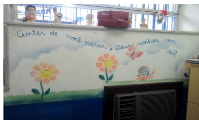
Ilustração 9. Parede da sala da secretaria escolar

As pinturas nas paredes falavam por si só. Na sala compartilhada pela secretaria, coordenação e direção escolar, em cada parede havia trechos de uma música evangélica, conforme mostra a Ilustração 9. A presença do enunciado religioso do gênero música na sala dos gestores da instituição revela não apenas permissão da circulação do discurso religioso, como também o incentivo a eles, especialmente por parte da direção.