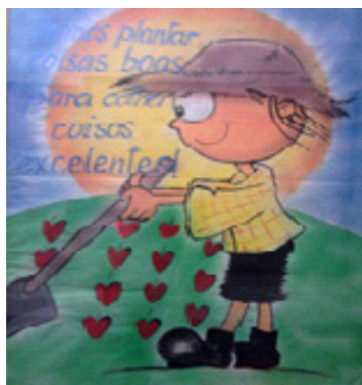
Ilustração 5. Mural do corredor principal

A temática da bondade permeava os enunciados de intenção religiosa. Os enunciados estavam presentes termos e expressões como “boa”, “bondade”, “fazer o bem”, dentre outros, como “plantar” e “colher” que remetem a imagens bíblicas. O jogo de palavras e imagens atribuía aos enunciados sentido religioso. Conforme mostram as figuras abaixo.