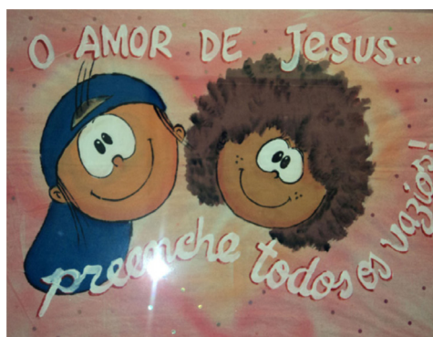
Ilustração 2. Um dos murais localizados no corredor principal da escola

Ao lado deste mural estava o de temática evangelística. As imagens de Mig e Meg próximas das palavras enunciadas mostram a intenção de marcar uma identidade religiosa: a evangélica. A frase indicava a intenção de evangelizar responsáveis. Também, ressaltava a religião evangélica como fonte de solução para todos os problemas, sendo até mesmo capaz de preencher os vazios de cada um, sejam eles resultantes de causas sociais, financeiras ou familiares, conforme observado na Ilustração 2.