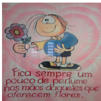
Ilustração 6. Mural do corredor da escola

Os murais de valorização dos sujeitos e de bondade ocupavam lugar de destaque. As duas temáticas dividiam o corredor de maior circulação, pois nele estavam situadas duas salas de atividades e os banheiros adultos e infantis e por ele se tem acesso à cozinha e ao refeitório. A intencionalidade dos quadros parecia ser a de evangelizar os adultos que circulavam pela instituição, sendo necessário que as mensagens de bondade e valorização dos sujeitos fossem expostas em espaços de fácil visualização.