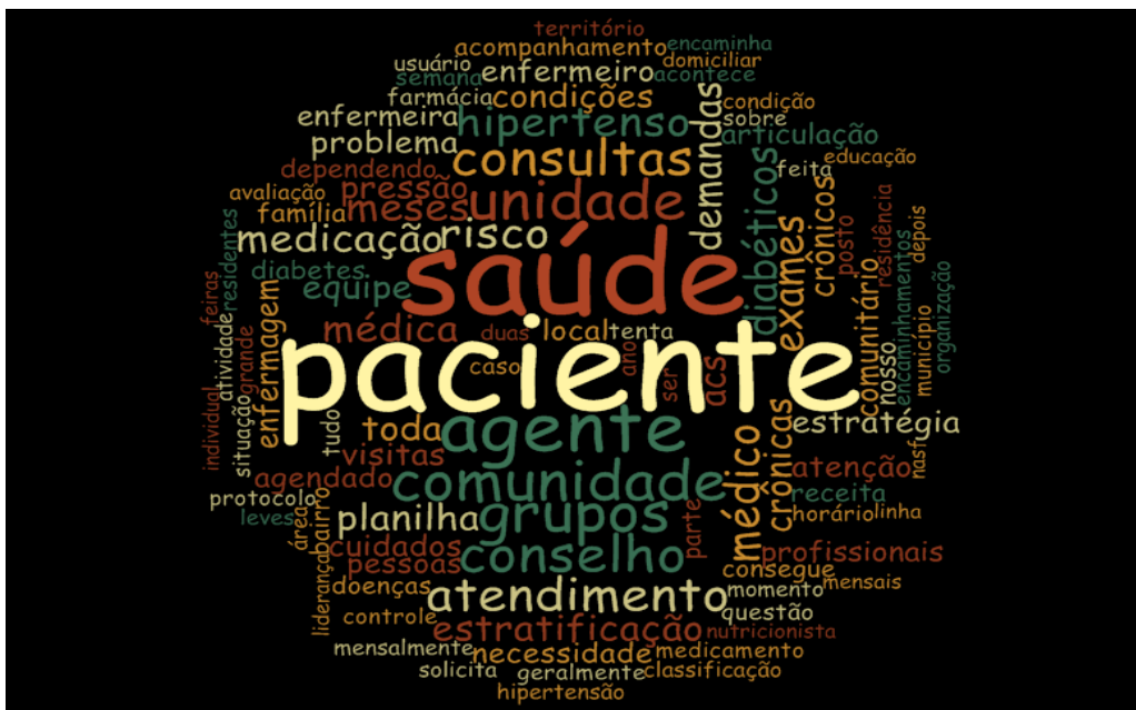
Figura 3 - Nuvem de palavras que mais se repetiram nos discursos dos entrevistados

A partir das falas selecionadas para compor os resultados deste estudo, foram identificadas as frequências de palavras de acordo com as fontes de dados, devidamente demonstradas na Nuvem de Palavras (Figura 3).