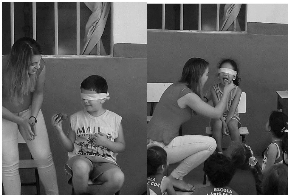
Figura 3 - Atividade de Educação Alimentar e Nutricional: Baú da Alimentação Saudável

isopor colocada no centro da sala de aula. Cada criança foi vendada e convidada a pegar um alimento; posteriormente, ela deveria adivinhar qual era o alimento através de um dos sentidos. 24 Nessa atividade os alunos puderam estimular seus sentidos e conhecer novos alimentos.