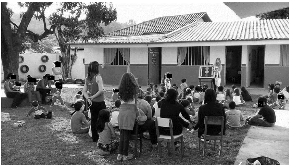
Figura 1 - Atividade de Educação Alimentar e Nutricional: Semáforo dos Alimentos

Posteriormente, para estimular o consumo dos alimentos in natura foram distribuídos os chamados sucos dos “super-heróis”: Suco do Hulk (couve com limão); Suco do Homem-Aranha e da Chapeuzinho Vermelho (beterraba com cenoura e laranja); Suco da Branca de Neve (inhame com leite).