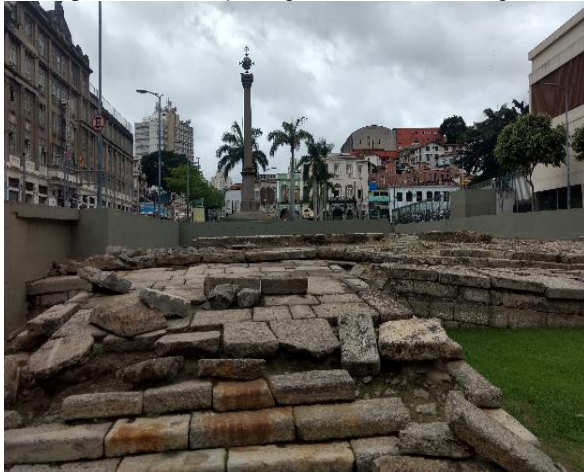
Figura 3. Sítio Arqueológico do Cais do Valongo.

Junto das ruínas do Cais do Valongo, foram encontradas cerca de 460 mil peças arqueológicas, dentre elas amuletos e adornos das culturas e religiões de matriz africana, que foram catalogadas e compõem hoje a coleção arqueológica do Sítio do Cais do Valongo. De acordo com Carneiro e Pinheiro (2015), as peças foram classificadas em dois grupos: as "de uso doméstico" e as "de uso religioso". A expressividade da coleção chamou imediatamente a atenção do Poder Público, tendo o então prefeito Eduardo Paes afirmado que se tratava da "maior coleção de cultura material dos africanos". O Sítio Arqueológico do Cais do Valongo foi oficialmente inaugurado em julho de 2012, classificando-se como um "museu a céu aberto", onde são expostas as ruínas do calçamento de pedras (Ver Figura 3).