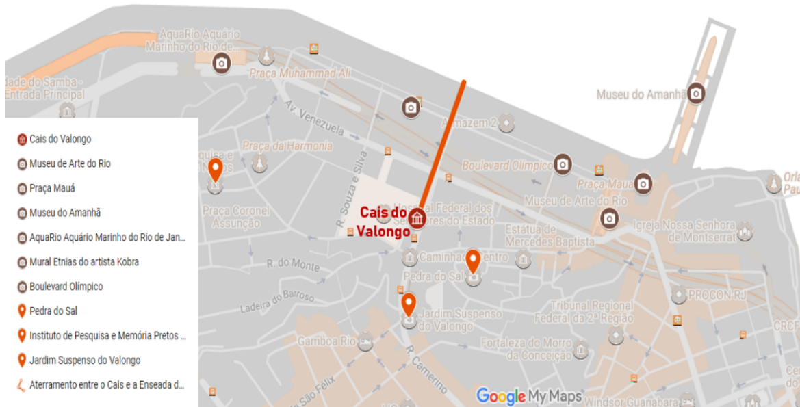
Figura 2. Mapa da Zona Portuária do Rio de Janeiro (em destaque).