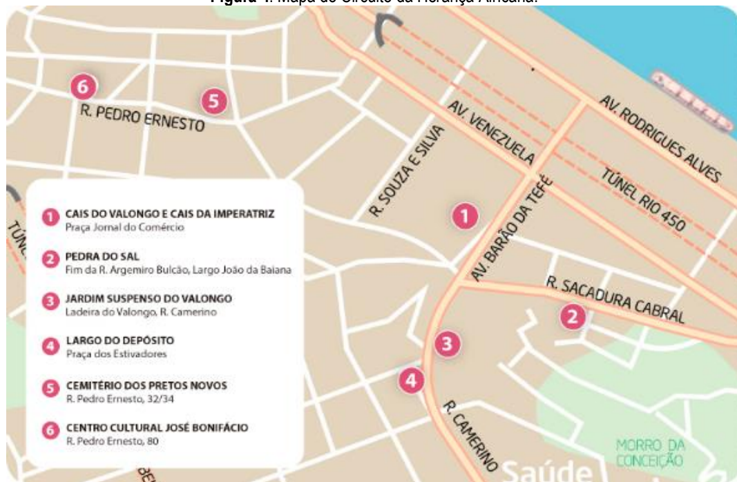
Figura 4. Mapa do Circuito da Herança Africana.