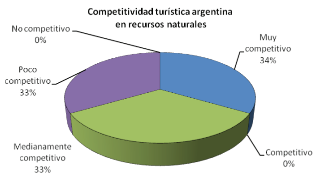
Figura 3. Competitividad turística argentina en recursos naturales