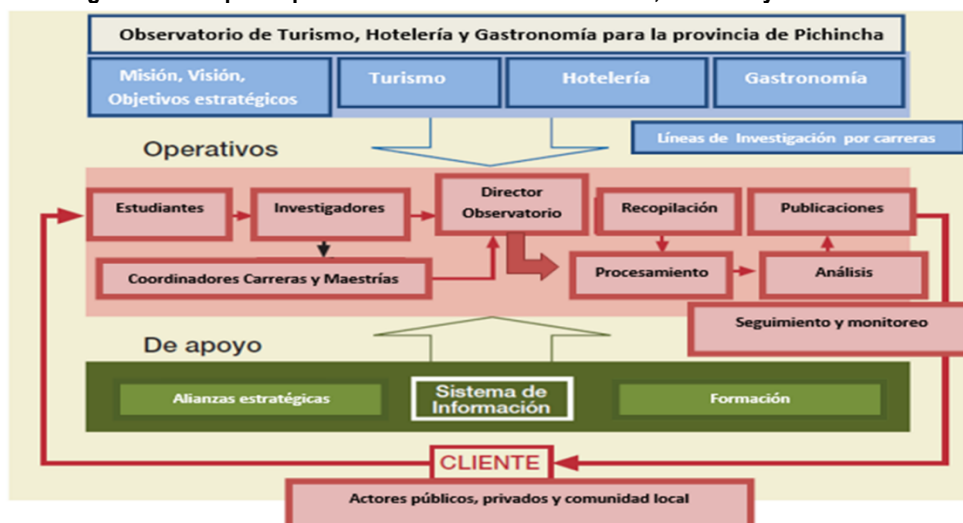
Figura 2 - Enfoque de procesos: Observatorio de Turismo, Hotelería y Gastronomía.

Metodológicamente, para la creación del observatorio se utiliza el “Enfoque de Procesos”, basado en la realización de un conjunto de actividades mutuamente relacionadas las cuales transforman elementos de entrada en resultados sobre la base del enfoque sistémico: procesos continuos que se van mejorando a través de la retroalimentación. Esto ha permitido el diseño de un esquema de trabajo (Figura 2) que se irá perfeccionando a medida que la dinámica del trabajo del observatorio así lo requiera.