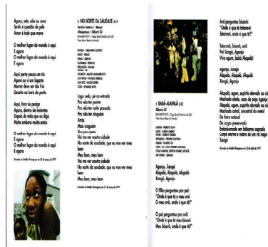
Figura 10 – Encarte do LP Refavela