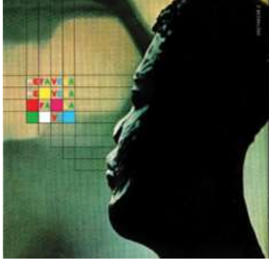
Figura 9 – Contracapa do LP Refavela

uma visão desta influência: traz uma estatueta fotografada no evento (Figura 9) e o encarte com fotos do FESTAC. Sobre esta passagem pela Nigéria (Figura 10), Gil diria: “ Tinha chegado do Festac, da Nigéria, cheio de roupas africanas, coisas africanas. Tanto é que a estatueta que tem na contracapa de Refavela, uma estatueta de madeira, é que eu pedi que fosse fotografada em close, fosse incluída ” 3 ”.